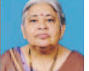
માલાબેન જે વોરા ફોન : ૨૩૨૧૧૧૨૦