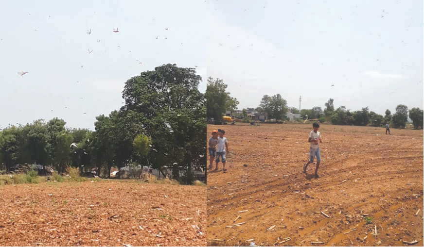
માસની ૨૨ તારીખથી ૧૫ જુલાઈ એટલે કે ૨૩ દિવસ દરમિયાન રણ તીડ આક્રમણ કરે તેવી સંભાવના વ્યક્ત કરવામાં આવી રહી છે. યમાન, સોમાલીયાથી કિનારા માર્ગે ગુજરાતના દ્વારકા

કેન્દ્રની તીડ નિયંત્રણ ટીમો યમન અને સોમાલીયાથી દરિયા કિનારે તીડના મોટા ઝુંડ ટ્રેસ કરતા દેશના વિવિધ રાજ્યો તેમજ ગુજરાતને પણ સાવધાન કરાયું છે. કારણ કે જૂનના અંતિમ સપ્તાહથી લઈ જુલાઈના પ્રથમ પખવાડિયા દરમિયાન તીડના મોટા ઝુંડ રાજ્યમાં આવી શકે તેવી સંભાવના વ્યક્ત કરાઈ છે. ૫ થી ૭ કિમી.નું એક ઝુંડ પ્રતિ ચોરસ કિમી.માં તીડની સંખ્યા ૮ કરોડ થી વધુની હોઈ શકે છે.