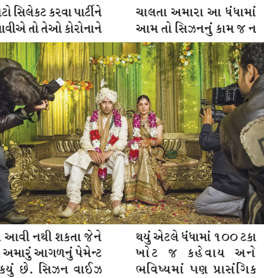
તે ફોટો સિલેક્ટ કરવા પાર્ટીને બોલાવીએ તો તેઓ કોરોનાને ચાલતા અમારા આ ધંધામાં આમ તો સિઝનનું કામ જ ન થયું એટલે ધંધામાં ૧૦૦ ટકા ખોટ જ કહેવાય અને ભવિષ્યમાં પણ પ્રાસંગિક

છે તે નગરમાં હાલ તમામ કાર્યક્રમો બંધ છે. લગ્ન જેવા શુભ પ્રસંગો પર હાલ પહેલા જેટલી છૂટછાટ નથી ત્યારે બીજા શહેરો કરતા નગરના ફોટોગ્રાફરને મોટું નુકશાન થયું છે. અમારી ટીમ જે હરહંમેશ અમારા સાથે ફોટો અને વિડીયોગ્રાફીના કાર્ય સાથે સંકળાયેલી છે અને અમને મળતા ઓર્ડર પર જ પોતાનું ગુજરાન ચલાવતા ફોટોગ્રાફર અને વિડીયોગ્રાફર હાલ કામ વગરના બેઠા છે. ઓછામાં પુરું પાછળના દિવસોમાં અમે પ્રાસંગિક ફોટોગ્રાફી કરી હોય