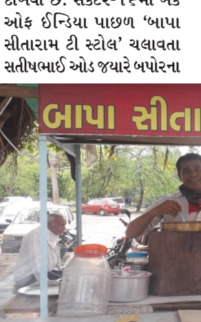
સમયે ચાની ડિલીવરી આપવા જઈ રહ્યા હતા ત્યારે તેમની કિટલી નજીક રસ્તામાંથી તેમને રૂ. ૬૫૦૦ રોકડા મળી આવ્યા હતા. આ નાણાં તેમણે પોતાની પાસે રાખ્યા અને તેની કોઈને જાણ ના કરી જેથી તેનો મૂલ માલિક નાણાં શોધતો આવે તો તેને પરત કરી શકાય અને કોઈ લેભાગુ ખોટું બોલી નાણાં પડાવી ના જાય.

ગાંધીનગર, તા. ૧૬ કોણ કહે છે કળિયુગ આવ્યો? એક તરફ કોરોના મહામારીના કારણે સતત બે ત્રણ મહિના સુધી ચાલેલી લોકડાઉનની સ્થિતિમાં નાના મોટા તમામ વેપાર ધંધા વ્યવસાય બંધ રહ્યા હતા જેને કારણે ખાસ કરીને મધ્યમવર્ગ તથા રોજીરોજ મહેનત કરીને કમાણી કરી રોજી રોજનું ગુજરાન ચલાવતા શ્રમજીવીઓને ખૂબ જ મોટો આર્થિક ક્રેટકો પડ્યો છે. જોકે આ સ્થિતિમાં પણ આ શ્રમજીવીઓએ પોતાની પ્રમાણિકતા છોડી નથી તેનો મોટો પુરાવો આજે ગાંધીનગરના સેક્ટર-૧૬માં ચાની કિટલી ચલાવતા એક શ્રમિકે રસ્તા પરથી મળેલા રોકડા રૂ. ૬૫૦૦ તેના મૂળ માલિકને પરત કરીને પુરો પાડ્યો છે.