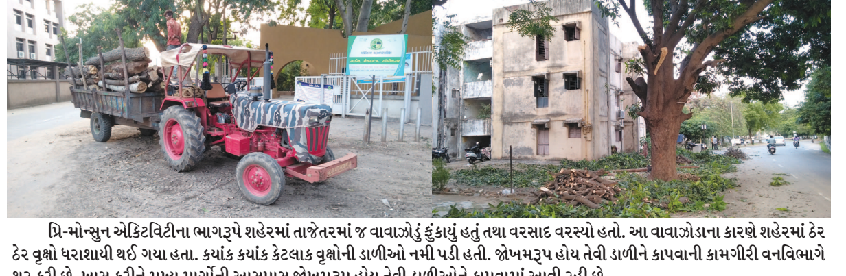
મિ.નોનુનુ એક્ટિવિટીના ભાગરૂપે શહેરમાં તાજેતરમાં જ વાવાઝોડું હુંકાર્યું હતું તથા વરસાદ વરસ્યો હતો. આ વાવાઝોડાના કારણે શહેરમાં ઢેર ઢેર વૃક્ષો ધરાશયી થઈ ગયા હતા. કયાંક કયાંક કેટલાક વૃક્ષોની ડાળીઓ નમી પડી હતી. જોખમરૂપ હોય તેવી ડાળીને કાપવાની કામગીરી વનવિભાગે શરૂ કરી છે. ખાસ કરીને મુખ્ય માર્ગોની આસપાસ જોખમરૂપ હોય તેવી ડાળીઓને કાપવામાં આવી રહી છે.