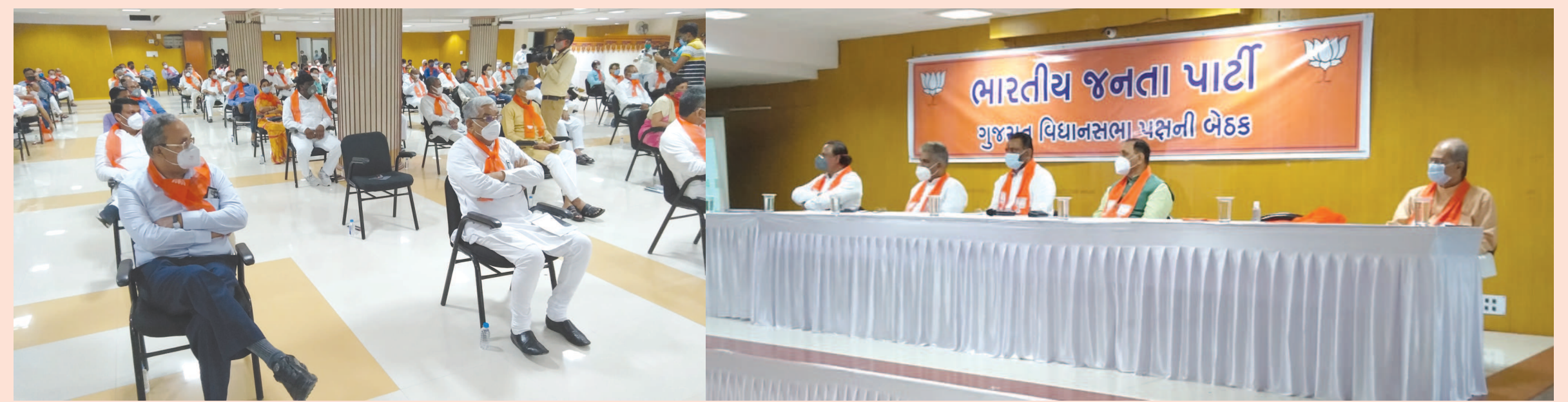
રાજકીય ધમધમાટ - રાજ્યસભાની ૪ બેઠકોની ચૂંટણી સંદર્ભે ભારતીય જનતા પાર્ટી વિધાનસભા પક્ષની બેઠક શહેરના સેક્ટર-૧૨ ખાતે ઉમિયા હોલમાં યોજાઈ હતી... જેમાં મુખ્યમંત્રી વિજયભાઈ રૂપાણી અને પ્રદેશ અધ્યક્ષ જીતુભાઈ વાઘાણી સહિત કેન્દ્રીય નિરીક્ષકો અને ધારાસભ્યો ઉપસ્થિત રહ્યા હતા... આ બેઠકમાં રાજ્યસભાના મતદાન અંગે વિધિવત સમજ અપાઈ હતી અને સૌને પક્ષના આદેશનું પાલન કરવા અનુરોધ કરાયો હતો...