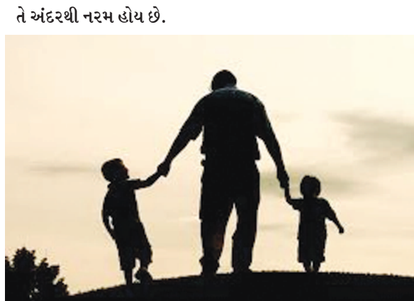
પિતાની હાજરી સુરજ જેવી હોય છે. સુરજ ગરમ જરુર થાય છે પણ તેની અનઉપસ્થિતિમાં અંધારું છવાઈ જાય છે. ભારતીય કિલ્મ જગતમાં તો પિતાના ત્યાગ અને સમર્પણ પર ઘણી કિલ્મો બની ચુકી છે.

બાપા, પિતાજી, તાત, પપ્પા, ડેડી, વાલિદ, અબ્બાજાન આમ કોઈ પણ એક સંબોધનથી બાળક પિતાને બોલાવે છે. કહેવાય છે કે એક પિતા એ દિકરાના પ્રથમ હીરો અને દીકરીનો પ્રથમ પ્રેમ છે. દીકરો નાનાથી મોટો થાય ત્યાં સુધી પોતાના પિતાની કોપી કરતો હોય. પિતાના ચપ્પલ, શુઝ તેમની બોલવાની ઢબ કે તેમની અમુક સ્ટાઈલમાં દીકરો પિતાનું અનુકરણ કરે છે. કહેવાય છે કે, માતાને હંમેશા દિકરો અને પિતાને પોતાની દીકરી વધાવી હોય છે. એટલે જ તો દિકરી જ્યારે સાસરે જાય ત્યારે સૌથી વધુ દુઃખ દીકરીના પિતાને થાય છે અને ઘરમાં જ્યારે દીકરાની વધુ આવે ત્યારે સૌથી વધુ ખુશી માતાને થાય છે. પિતા પોતાના બાળકના જીવનમાં શિસ્ત, નૈતિકતા અને માર્ગદર્શન આપવામાં મોટી ભૂમિકા ભજવે છે. પિતાનું સમગ્ર જીવન પોતાના બાળકોના ઉજવણ બલિધ્ય અને જરૂરિયાતો પૂર્ણ કરવામાં જ નકળી જાય છે. પિતાના પ્રેમની કોઈ સીમા નથી હોતી. માતા હંમેશા પોતાના બાળકોને પિતાની બીક આપતી રહેતી હોય છે. જેથી બાળક ભણવા બેસે અથવા તો શિસ્તમાં રહે અને ક્યારેક પિતા એ આ બાબતને લઈ બાળક પર ગુસ્સો કરી લીધો હોય એટલે બાળક પણ પિતાથી ડરતો હોય છે. પરંતુ આ કઠણ દેખાતા પિતાનું હૃદય એટલું કઠણ નથી હોતું