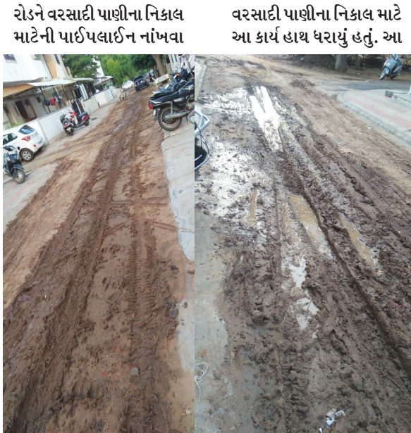
તંત્ર દ્વારા ખોદી નાંખવામાં આવ્યો હતો. આ રહેણાંક પ્લોટસની નજીકના અંબાજી મંદિરના ચોકમાં ભરાતા સાથે સેક્ટર-૬ના આંતરિક માર્ગોના નવીનીકરણનું કાર્ય પણ હાથ ધરવામાં આવ્યું હતું જ્યારે સ્ટોર્મ વોટર

ગાંધીનગર, તા. ૨૦ ગાંધીનગરના સેક્ટર-૬-એના રહેણાંક વિસ્તારમાં વરસાદી પાણીના નિકાલ માટે રોડ તોડીને પાઈપલાઈન નાંખવાનું કામ તાજેતરમાં હાથ ધરવામાં આવ્યું હતું. આ કાર્ય બાદ આ વિસ્તારમાં કોવિડ-૧૯ના કેસને કારણે કન્ટેનમેન્ટ વિસ્તાર જાહેર થતાં રોજ નિર્માણનું કાર્ય અધૂરું રહી જવા પામ્યું છે જે આજદિન સુધી પુરું કરવામાં આવ્યું ના હોવાથી તાજેતરમાં પડેલા વરસાદ પછી કાદવ કીચડ સાથે મોટા ખાડા પડી જવા પામ્યા છે. જેના કારણે આ વિસ્તારના રહીશોને ભારે હાલાકીનો સામનો કરવો પડી રહ્યો છે.