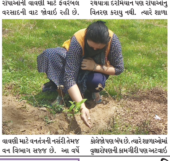
રથયાના દરમિયાન પણ રોપાઓનું વિતરણ કરાયું નથી. ત્યારે શાળા વાવણી માટે વનતંત્રની નર્સરી તેમજ વન વિભાગ સજ્જ છે. આ વર્ષે કોલેજો પણ બંધ છે. ત્યારે શાળાઓમાં વૃક્ષારોપણની કામગીરી પણ અટવાઈ

ગાંધીનગર તા ૨૪ ગાંધીનગરમાં નવા રોપાઓની વાવણી માટે ખાડા ખોદી દેવાયા છે. જ્યારે પ્રારંભિક વરસાદના અંતે કેટલાક ઠેકાણે રોપાઓની વાવણી પણ કરી દેવામાં આવી છે. આમ છતાં હજુ નવા રોપાઓની વાવણી માટે ફેવરેબલ વરસાદની વાટ જોવાઈ રહી છે. વનતંત્રની નર્સરીમાં સેકડો રોપાઓ પણ તૈયાર છે. જ્યારે અનુરૂપ વરસાદના અંતે રોપાઓની વાવણી માટે કામગીરી પણ શરૂ કરી દેવાશે. ગાંધીનગરમાં દરવર્ષે નવા રોપાઓની વાવણી કરવામાં આવે છે. જ્યારે વરસાદી ઝાપટના અંતે વનતંત્ર દ્વારા કેટલાક ઠેકાણે રોપાઓની વાવણી કરવામાં આવી છે. પરંતુ હજુ