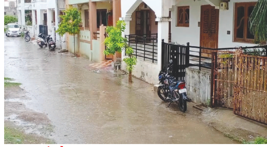
ધનસુરામાં ધોધમાર વરસાદ અરવલ્લી જિલ્લામાં વરસાદી માહોલ જોવા મળ્યો જિલ્લાના ધનસુરામાં ધોધમાર વરસાદ વરસ્યો હતો. ધનસુરામાં ધોધમાર વરસાદ વરસતા રોડ પર પાણી ભરાયા હતા. ધનસુરામાં વીજ કડાકા સાથે વરસાદ વરસ્યો હતો. વરસાદ વરસતા વાતાવરણમાં ઠંડક પ્રસરી હતી. વરસાદને લઈને અસહ્ય ગરમી અને ભારે બાફથી લોકોને રાહત થઈ હતી. હવામાન વિભાગે અરવલ્લીમાં ભારે વરસાદની કરી આગાહી કરી છે.

ગાંધીનગર, તા. ૨૫ વિપક્ષ નેતા પરેશ ધાનાણીએ પણ સીએમ રૂપાણી સમક્ષ એક માંગ મૂકી છે. પરેશ ધાનાણીએ સીએમ રૂપાણીને જણાવ્યું છે કે, કોરોના મહામારી મામલે ગુજરાતના દરેક જિલ્લામાં અદ્યતન હોસ્પિટલ ઉભી કરવી, આરોગ્ય સ્ટાફને ડ્રીટ, માસ્ક, સેનેટાઈઝર સહિત સુરક્ષા માટે અન્ય વસ્તુઓ ઉપલબ્ધ કરાવવી. તે છતાં કોરોના દર્દીઓને અપૂરતી સારવાર તથા ટેસ્ટિંગની સુવિધાઓના અભાવે વધુમાં વધુ દર્દીઓ મોતના મુખમાં ધકેલાઈ રહ્યા છે. અન્ય રાજ્યોની સરખામણીએ ગુજરાતમાં કોરોના ટેસ્ટિંગ યાજર્ વધુ એટલે ૪૫૦૦ રૂપિયા લેવાય છે. ટેસ્ટિંગ ક્રીટ બંધે સરખી જ હોય છે તો કેમ ગુજરાતમાં યાજર્ વધુ લેવાય છે. ધાનાણીએ વધુમાં જણાવ્યું છે કે વધુ યાજર્ને લીધે લોકો કોરોનાનું સંક્રમણ હોવા છતાં ટેસ્ટ નહિ કરાવે સારવાર નહિ કરાવે જેથી વધારે લોકો મોતના મુખમાં ધકેલાઈ રહ્યા. ગુજરાત સરકારે કોરોના ટેસ્ટિંગનો યાજર્ ૨૦૦૦ નક્કી કરવો જોઈએ અને એ પૈકી ૧૦૦૦ રૂપિયાનો ખર્ચ દર્દીઓ મોતના મુખમાં ધકેલાઈ રહ્યા છે.