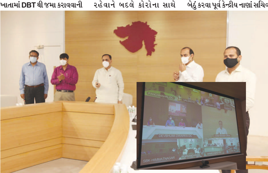
અભિનવ પહેલનો પ્રારંભ કરાવ્યો હતો. મુખ્યમંત્રીએ રાજ્યના જિલ્લા મધ્યકોએથી વિડીયો કોન્ફરન્સના માધ્યમથી જોડાયેલા ઉદ્યોગ-વેપાર પ્રતિનિધિઓને આ સહાય અર્પણ વેળાએ પ્રેરણા આપતાં કહ્યું કે, ઉદ્યોગ વેપાર તો ગુજરાતના DNAમાં રહેલા છે ત્યારે કોરોના કોરોના કરીને બેસી

ગાંધીનગર, તા. ૨૬ મુખ્યમંત્રી વિજયભાઈ રૂપાણીએ કોરોના-કોવિડ-૧૯ સંક્રમણ પછીની બદલાતી વૈશ્વિક આર્થિક સ્થિતિનો મહત્તમ લાભ લઈ આફતને અવસરમાં પલટાવવા રાજ્યના લઘુ-મધ્યમ અને સ્થૂર્ણ ઉદ્યોગકારોને આહવાન કર્યું છે. આ સંદર્ભમાં તેમણે સ્પષ્ટપણે જણાવ્યું કે, કોરોના સંક્રમણ સામે "જન હે-જહાન હે"ના ધ્યેય સાથે રોજિંદી જીવન પ્રવૃત્તિઓ, વેપાર, ઉદ્યોગ, ધંધા-રોજગાર ફરી ધમધમતા-ધબકતા કરવા રાજ્ય સરકાર આવા ઉદ્યોગ-ધંધા-વેપારને પ્રોત્સાહન આપવા પ્રતિબદ્ધ છે. મુખ્યમંત્રીએ રાજ્યભરના જિલ્લાઓના ૧૨૨૪૭ MSME ઉદ્યોગકારોના બેન્ક ખાતામાં રૂ. ૭૬૮ કરોડ અને ટેક્ષટાઈલ ઉદ્યોગ સહિતના અન્ય મોટા ઉદ્યોગોના ૮૩૫ એકમોને રૂ. ૬૦૧ કરોડની સહાય મળી કુલ ૧૩ હજાર એકમોને રૂ. ૧૩૬૯ કરોડની સહાય એક જ ક્લીકથી ગાંધીનગર બેઠા આ ઉદ્યોગકારોના બેન્ક