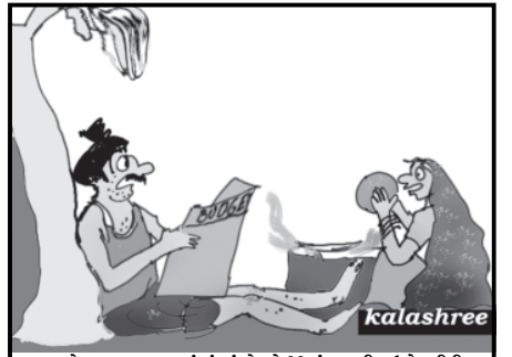
બજેટ જાણવા આટલું શું વાંચો છો ?? હું જ કહી દઉં કે, બીડીના ભાવ વધ્યા હશે ને માચીસનાં ઘટ્ટ્યા હશે. ટ્રેક્ટર સસ્તા થયા હશે પણ, ટાયર મોંઘા થયા હશે... બિયારણ સસ્તું કર્યું હશે પણ વિજળી મોંઘી કરી હશે... બોલો એવું છે કે નહીં!!!

અમદાવાદ, તા.૧ સીબીએસસી ધોરણ ૧૦ અને ૧૨ના વિદ્યાર્થીઓનો બોર્ડની પરીક્ષાનો શુક્રવારથી પ્રારંભ થયો છે. જેમાં દેશભરમાંથી ધોરણ ૧૦ના ૧૨ લાખ અને ધોરણ ૧૨ના ૧૦ લાખ કરતા વધુ વિદ્યાર્થીઓ પ્રથમ દિવસે પરીક્ષા આપવા બેઠા હતા. સીબીએસસી તરફથી ખહેર કરવામાં આવેલા નિવેદનમાં જણાવવામાં આવ્યું હતું કે બોર્ડની પરીક્ષાના પ્રથમ દિવસે ધોરણ ૧૦ના ૧૨,૫૬,૨૦૨ વિદ્યાર્થીઓ પરીક્ષામાં બેઠા હતા. જ્યારે ધોરણ ૧૨ની પરીક્ષામાં ૯,૪૨,૦૩૫ વિદ્યાર્થીઓએ ભાગ લીધો હતો. જેમાં ગુજરાતમાંથી ધોરણ ૧૦ના ૪૩૪૨૦ વિદ્યાર્થીઓએ પરીક્ષા આપી હતી. જ્યારે ધોરણ ૧૨ના ૩૨૪૮૩ વિદ્યાર્થીઓએ પરીક્ષા આપી હતી. ઉલ્લેખનીય છે કે ગત વર્ષની તુલનામાં આ વર્ષે ધોરણ ૧૦માં ૬.૭૦ ટકા જ્યારે ધોરણ ૧૨માં ૧૫.૫૧ ટકા વધુ વિદ્યાર્થી નોંધાય છે. આ વખતે સીબીએસસી ધોરણ ૧૦ અને ૧૨ના વિદ્યાર્થીઓ માટે ઓનલાઈન રોલ નંબર અનુસાર ભેટક વ્યવસ્થા ગોઠવવામાં આવી છે. એટલું જ નહીં સીબીએસસી પરીક્ષામાં ભાગ લઈ રહેલ