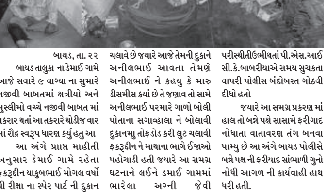
બાયડ, તા. ૨૨

પરીસ્થિતી ઉભી થતાં પી.એસ.આઈ સી.કે.બાબરીયાએ સમય સુચકતા વાપરી પોલીસ બંદોબસ્ત ગોઠવી દીધો હતો જ્યારે આ સમગ્ર પ્રકરણ માં હાલ તો બન્ને પક્ષે સાસમે ફરીગાદ નોંધાતા વાતાવરણ તંગ બનવા પામ્યું છે આ અંગે બાયડ પોલીસે બન્ને પક્ષ ની ફરીયાદ સાંભળી ગુનો નોંધી આગળ ની કાર્યવાહી હાથ ધરી હતી.