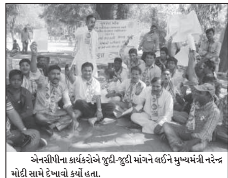
એનસીપીના કાર્યકરોએ જુદી-જુદી માંગને લઈને મુખ્યમંત

બોલીવુડનો જાણીતો ચહેરો સોહા અલીખાન જણાવે છે કે આજની ફિકેટની રમત અગાઉની રમત કરતા ઘણી જ જુદી છે. મારા જેવા ફિકેટના ચાહકો માટે એરિયલ કલર એન્ડ સ્ટાઈલ મદદ આપ્યું છે, તેના કારણે મારા ડાઘાઓ દૂર થતા નથી, પરંતુ તે કલરને જતો પણ અટકાવે છે.