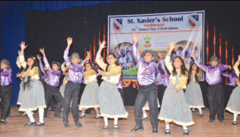
વાર્ષિકોત્સવ - ગાંધીનગરની પ્રતિષ્ઠિત શિક્ષણ સંસ્થા સેન્ટ ઝેવિયસના બાળકોએ જગતના તાતની રસપ્રદ શૈલીમાં નૃત્યની અભિવ્યક્તિ કરી હતી... દેશના વિવિધ પ્રાંતોમાં કૃષિ ક્ષેત્રના વિવિધ પાસાઓ અને ખેડૂતોની રસપ્રદ વાતોને વણી લેતા થીમ પર સાંસ્કૃતિક કાર્યક્રમ રજૂ થયો હતો. વિદ્યાર્થીઓ, વાલીઓ અને આમંત્રિતોથી ખીચોખીચ ભરાયેલા ટાઉનહોલમાં સાંસ્કૃતિક માહોલ છવાયો હતો.