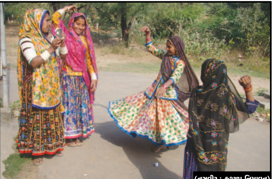
રંગીલો ફાગણ આયો રે... - હોળી પર્વ એટલે લોકપર્વ... વર્ગ કે જ્ઞાતિના ભેદ સિવાય ઉમંગથી ઉજવાતું પર્વ એટલે હોળી પર્વ... ઉમંગ એ રંગ-રંગમાં પ્રસરે, સમાજના તમામ સ્તરે પ્રસરે અને સૌ એક-મેકને ઉદારતાથી ગઈકાલ ભૂલી પ્રેમથી ભેટ એ જ હોળીનો ઉમંગ, એ જ હોળીનો રંગ... નૃત્ય, તાલ અને લય સાથે રાજસ્થાની પરિવાર ગાંધીનગરની ગલીઓમાં મારવાડી મહેક પ્રસરાવે છે ત્યારે હોળીના આગમનના એકાદ પ્રથમ દિવસ છે...

અમદાવાદ, તા. ૩ આગામી ૧૨ માર્ચથી રાજ્યમાં ધોરણ-૧૦ અને ૧૨ ની બોર્ડની પરીક્ષા શરૂ થઈ રહી છે. હોલ ટિકિટોનું વિતરણ આવતીકાલથી કરવામાં આવનાર છે. આ પરીક્ષા દરમિયાન વિદ્યાર્થીઓ સ્વાઈન ફ્લુનો ભોગ ન બને તે માટે તકેદારીનાં ખાસ પગલા લેવા માટે શિક્ષણ બોર્ડ અને રાજ્ય આરોગ્ય વિભાગના અધિકારીઓની બેઠક મળી હતી. જેમાં શિક્ષણ બોર્ડ દ્વારા વિદ્યાર્થીઓને હોલટીકીટ સાથે સ્વાઈન ફ્લુનાં લક્ષણો અને સાવચેતી અંગે માહિતી આપતી પુસ્તીકાનું વિતરણ કરવાનું નક્કી કરવામાં આવ્યું છે. આ ઉપરાંત પરીક્ષા દરમિયાન વિદ્યાર્થીઓને માસ પહેરવાની સુચના આપવામાં આવી છે. આ અંગે ગુજરાત માધ્યમિક અને ઉચ્ચતર માધ્યમિક શિક્ષણ બોર્ડનાં ઉચ્ચ અધિકારીઓએ જણાવ્યું હતું કે, ધોરણ-૧૦ અને ધોરણ-૧૨ ની જાહેર પરીક્ષાઓને ધ્યાને લેતા વર્તમાન સમયમાં ઉભી થયેલી સ્વાઈન ફ્લુની વ્યાપક પરિસ્થિતિને ધ્યાને લઈ રાજ્યના આરોગ્ય વિભાગનાં કમિશનર તથા ઉચ્ચ અધિકારીઓ સાથેની બેઠકમાં સ્વાઈન ફ્લુને અટકાવવા તથા તેના રોગને અટકાવવાની જાણકારી આપતી પત્રિકાઓનું વિતરણ આરોગ્ય વિભાગ દ્વારા દરેક જિલ્લામાં વિદ્યાર્થીઓને તેમની હોલ ટીકિટની સાથે આપવાનું નક્કી કરવા માં આવેલ છે. સાથે સાથે વિદ્યાર્થીમાં રોગપ્રતિકારક ક્ષમતા વધારનારી આયુર્વેદિક, હોમિયોપેથિક દવાઓનું વિતરણ અને રાજ્યનાં તમામ પરીક્ષા કેન્દ્રો પર માસ્ક અને સેનેટાઈઝરની વ્યસ્થા આરોગ્ય વિભાગ દ્વારા કરવામાં આવનાર છે. તેની સૂચના