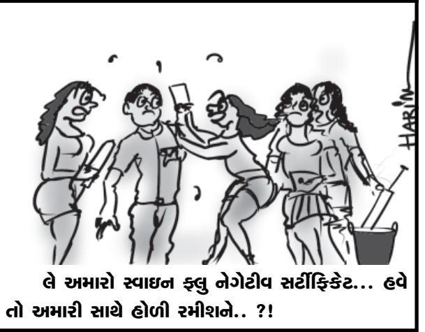
લે અમારો સ્વાધન ફલુ નેગેટીવ સર્ટીફિકેટ... હવે તો અમારી સાથે હોળી રમીશને.. ?!