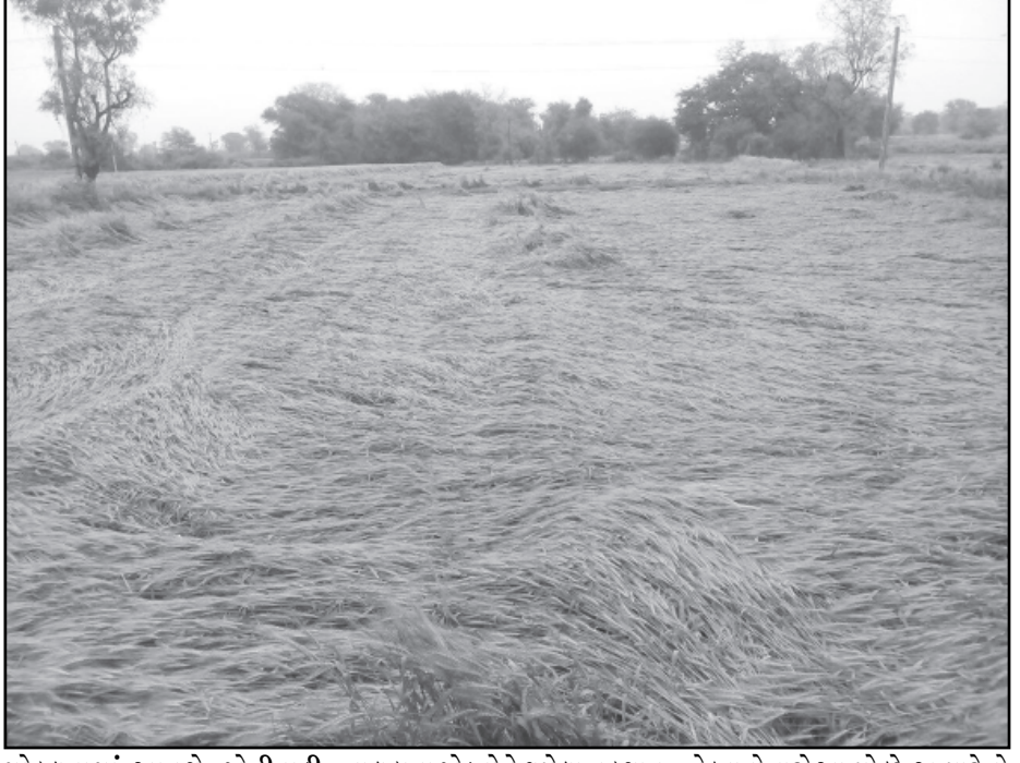
મોકલવામાં આવશે. ખેતીવાડી વિભાગના જણાવ્યા મુજબ રવિ સિઝનમાં ખેડૂતોએ ૭૨,૦૩૭ હેક્ટરમાં પાકનું વાવેતર કરવામાં આવ્યું છે. જેમાં ખેડૂતોએ મુખ્યત્વે ઘઉં અને બટાકાનું વાવેતર ૭૭૨૦૦ હેક્ટર જેટલી જમીનમાં કરવામાં આવ્યું છે. જેમાં કમોસમી વરસાદથી

ખેડૂતપૂરના જણાવ્યા અનુસાર છેલ્લા બે વર્ષથી રવિસીઝનમાં મોસમી વરસાદથી મોડાસા-ધનસુરા માવઠાના કારણે ખુબ જ નુકસાની