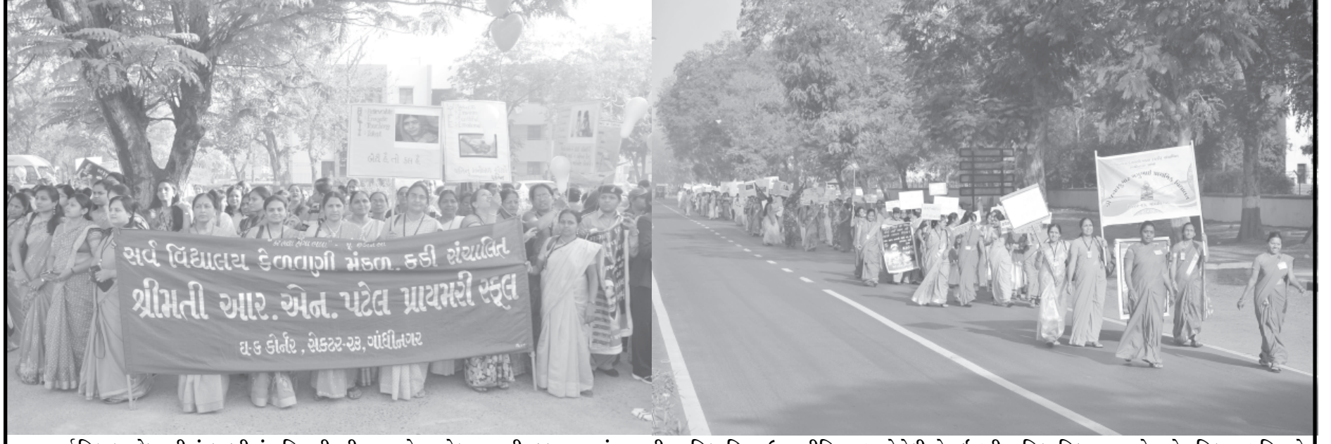
સર્વ વિદ્યાલય કેળવણી મંડળ કડી સંચાલિત શ્રીમતી આર. એન. પટેલ પ્રાયમરી સ્કૂલ દ્વારા આંતરરાષ્ટ્રીય મહિલા દિવસ ઉજવણીના ભાગરૂપે રેલી યોજાઈ હતી. મહિલા વિકાસના સૂત્રો સાથે મહિલા જાગૃતિ માટે રેલી સેક્ટર-૨૩ના આસપાસના આંતરિક માર્ગો પર નીકળી હતી. શાળાની બાળાઓએ મહિલા જાગૃતિના પ્લેકાર્ડ સાથે નીકળેલી રેલીએ આકર્ષણ જમાવ્યું હતું.