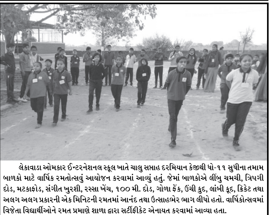
લેકાવાડા ઓમકાર ઈન્ટરનેશનલ સ્કૂલ ખાતે યાલુ સમાહ દરમિયાન કેટલી ધો-૧૧ સુધીના તમામ બાળકો માટે વાર્ષિક રમતોત્સવનું આયોજન કરવામાં આવ્યું હતું. જેમાં બાળકોએ લીલુ ચમચી, ત્રિપગી દોડ, મટકાકોડ, સંગીત પુરૂશી, રસ્સા ખેંચ, ૧૦૦ મી. દોડ, ગોળા ફેંક, ઉંચી કુદ, લાંબી કુદ, ક્રિકેટ તથા અલગ અલગ પ્રકારની એક મિનિટની રમતમાં આનંદ તથા ઉત્સાહભેર ભાગ લીધો હતો. વાર્ષિકોત્સવમાં વિજેતા વિદ્યાર્થીઓને રમત પ્રમાણે શાળા દ્વારા સર્ટીફિકેટ અનાયત કરવામાં આવ્યા હતા.

ગાંધીનગર શહેરના સેક્ટર-૩૦ સ્થિત મુક્તિધામ ખાતે લાયબ્રેરીનો શુભારંભ કરવામાં આવ્યો છે. મુક્તિધામ સ્થિત પ્રાર્થના હોલ ઉપરના માળે એકસોથી વધુ યુવક-યુવતિઓ વાંચી શકે તેવી વ્યવસ્થા કરવામાં આવી છે. મુક્તિધામની લાયબ્રેરીમાં વિદ્યાર્થીઓને ઉપયોગી પુસ્તકો મુકવામાં આવ્યા છે. વાંચનમાં અગવડતા ન પડે તે માટે વિદ્યાર્થીઓ માટે ખંખા, ઠંડા પાણીનું કુલર, ટેબલ-પુરૂશી સહિતની વ્યવસ્થા કરવામાં