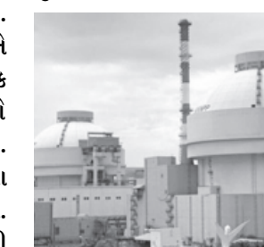
ભારત કરતા વધારે પરમાણુ હથિયારો છે. યુનિવર્સિટી ઓફ શિકાગો સાઈનિસ્ટ્સ દ્વારા વર્ષ ૧૯૪૫માં સ્થાપિત કરવામાં આવેલા બુલેટિન દ્વારા જે માહિતી આપવામાં આવી છે તે મુજબ પાકિસ્તાન પાસે ભારત કરતા વધારે ખતરનાક હથિયારો રહેલા છે. વર્ષ ૧૯૮૦ના દશકમાં ૬૫૦૦૦ જેટલા પરમાણુ હથિયારો હતા જેની સામે હવે હથિયારો ટુનિયાના દેશો ઘટાડી રહ્યા છે અને સંખ્યા ૧૦૦૦૦ જેટલી રહી છે. પરંતુ કેટલાક દેશો હજુ આવા ધાતક હથિયારો પર ધ્યાન કેન્દ્રિત કરી રહ્યા છે. નવ પરમાણુ દેશોમાં પરમાણુ હથિયારો અને તેમના ઈતિહાસની નોંધ રાખવામાં આવી છે. ઈન્ફોગ્રાફિક નામથી જુદી જુદી માહિતી ધરાવનાર સંસ્થા દ્વારા જણાવવામાં આવ્યું છે કે અમેરિકા પાસે ૩૦૦૦ હથિયારો પાસે આશરે ૫૦૦૦-૫૦૦૦ પરમાણુ હથિયારો છે. ફ્રાન્સ પાસે ૩૦૦, ચીન પાસે ૨૫૦, બ્રિટન પાસે ૨૨૫ અને ઈજરાયેલ પાસે ૮૦ પરમાણુ હથિયારો છે. ઉત્તર કોરિયા પાસે પણ આવા હથિયારો રહેલા છે. ઉત્તર કોરિયાએ વર્ષ ૨૦૦૬, ૨૦૦૮ અને ૨૦૧૩માં પરમાણુ પરીક્ષણ કર્યા હતા.

વોશિંગ્ટન, તા. ૧૦ પાકિસ્તાન પાસે આશરે ૧૨૦ પરમાણુ હથિયારો છે જ્યારે ભારત પાસે ૧૧૦ પરમાણુ હથિયારો રહેલા છે. એટોમિક સાઈનિસ્ટ્સના બુલેટીનમાં માહિતી આપવામાં આવી છે કે આ વર્ષે પાકિસ્તાનના શસ્ત્રાગારમાં ભારત કરતા વધારે પરમાણુ હથિયારો છે. યુનિવર્સિટી ઓફ શિકાગો સાઈનિસ્ટ્સ દ્વારા વર્ષ ૧૯૪૫માં સ્થાપિત કરવામાં આવેલા બુલેટિન દ્વારા જે માહિતી આપવામાં આવી છે તે મુજબ પાકિસ્તાન પાસે ભારત કરતા વધારે ખતરનાક હથિયારો રહેલા છે. વર્ષ ૧૯૮૦ના દશકમાં ૬૫૦૦૦ જેટલા પરમાણુ હથિયારો હતા જેની સામે હવે હથિયારો ટુનિયાના દેશો ઘટાડી રહ્યા છે અને સંખ્યા ૧૦૦૦૦ જેટલી રહી છે. પરંતુ કેટલાક દેશો હજુ આવા ધાતક હથિયારો પર ધ્યાન કેન્દ્રિત કરી રહ્યા છે. નવ પરમાણુ દેશોમાં પરમાણુ હથિયારો અને તેમના ઈતિહાસની નોંધ રાખવામાં આવી છે. ઈન્ફોગ્રાફિક નામથી જુદી જુદી માહિતી ધરાવનાર સંસ્થા દ્વારા જણાવવામાં આવ્યું છે કે અમેરિકા પાસે ૩૦૦૦ હથિયારો પાસે આશરે ૫૦૦૦-૫૦૦૦ પરમાણુ હથિયારો છે. ફ્રાન્સ પાસે ૩૦૦, ચીન પાસે ૨૫૦, બ્રિટન પાસે ૨૨૫ અને ઈજરાયેલ પાસે ૮૦ પરમાણુ હથિયારો છે. ઉત્તર કોરિયા પાસે પણ આવા હથિયારો રહેલા છે. ઉત્તર કોરિયાએ વર્ષ ૨૦૦૬, ૨૦૦૮ અને ૨૦૧૩માં પરમાણુ પરીક્ષણ કર્યા હતા.