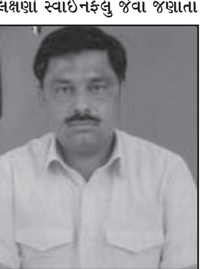
તાત્કાલિક અમદાવાદની આનંદ