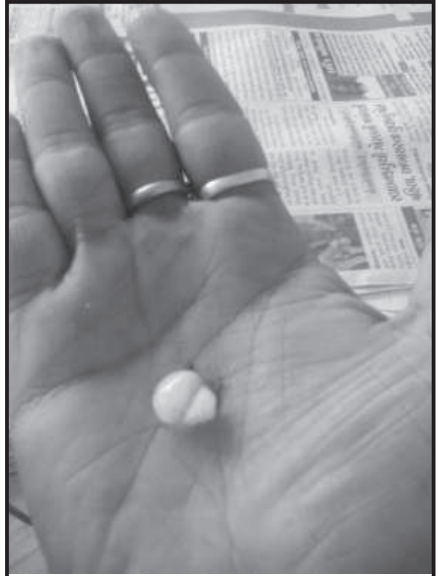
ખેડબ્રહ્મામાં કરા સાથે વરસાદ ખેડબ્રહ્મામાં શનિવારે બપોરે ગાજવીજ સાથે કરાનો વરસાદ પડ્યો હતો. વરસાદના કારણે ખેડૂતોમાં ભારે ચિંતાનો માહોલ જોવા મળ્યો હતો. (તસવીર : રમેશ વૈષ્ણવ, ખેડબ્રહ્મા)

પ્રાંતિજ, તા. ૧૬ મોખિકમાં જાણ કરવા છતાં સાબરકાંઠા જિલ્લાના પ્રાંતિજ ભાંખરીયા બસ સ્ટેશન પાસે આવેલ અદ્યતન ગોપીનાથ કોમ્પલેક્ષમાં ભોંયતળીયે આવેલ એક દુકાનને પ્રાંતિજ નગરપાલિકા દ્વારા સિલ મારવામાં આવ્યું હતું. મળતી માહિતી મુજબ પ્રાંતિજ નગરપાલિકા વિસ્તાર ભાંખરીયા પાસે આવેલ ગોપીનાથ કોમ્પલેક્ષમાં આવેલ દુકાન મોટી નીપાબેન હસમુખભાઈ કે જેવો દ્વારા પ્રાંતિજ નગરપાલિકા દ્વારા દર વર્ષે લેવામાં આવતો વેરો આજદિન સુધી દુકાન માલિકને લેખિત તથા