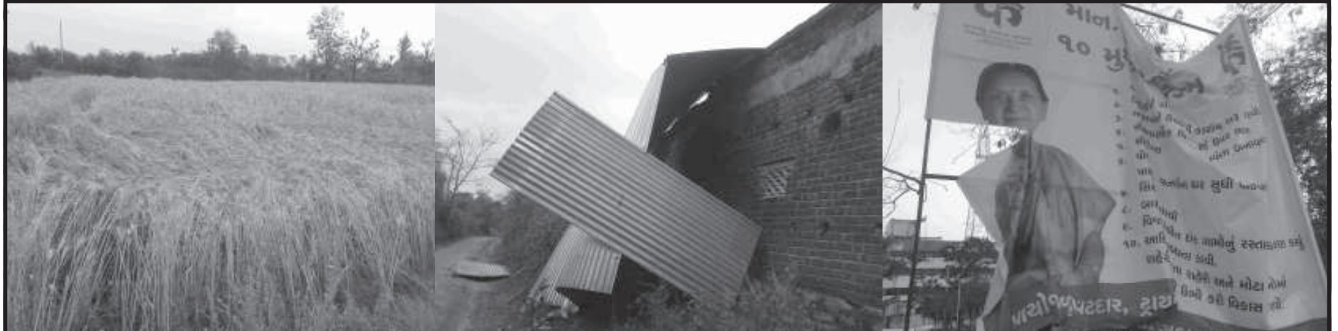
બનાસકાંઠામાં કમોસમી વરસાદથી ઉભો પાક નષ્ટ થતા ખેડૂતો ચિંતાતુર બનાસકાંઠા જિલ્લામાં શુક્ર-શનિ પડેલા કમોસમી ભારે વરસાદથી શિયાળુ પાકને મહદ અંશે નુકશાન થયું છે જેથી ધરતીપુત્રો ચિંતાતુર બની ગયા છે. બનાસકાંઠામાં આંધી-પવન અને વીજળીના કડાકા-ભડાકા સથે ભર ઉનાળો ચોમાસાનો માહોલ જયારે વહેલી સવારે કડકડતી ઠંડીથી શિયાળો એમ એક સાથે ત્રેવડી ઋતુ સર્જતા જનજીવન પર ભારે ઉથલ પાથલ સર્જઈ હતી. કમોસમી વરસાદને પગલે ખેતરમાં ઉભા અરંડા, ઘઉં, વરિયાળી, રાઈ સહિતના પાકોને પણ નુકશાન પહોંચ્યું છે.

શબ્દાવલી પડકરના જવાબ આડી ચાવી :- (૧) ગગન (૩) સિક્કા (૬) નિજળા (૮) તક (૯) નાકાબંધી (૧૨) પસવાળવું (૧૩) લોભ (૧૫) રીત (૧૭) તલાટી (૧૮) સર્વત્ર (૧૯) ટીમ (૨૦) અથાગ (૨૨) પાપડખાર ઊભી ચાવી :- (૨) ગર્જના (૨) ગળાકાપર (૪) ફટકવું (૫) તક (૭) સંધીવાત (૧૦) બંસરી (૧૧) લીલોતરી (૧૪) ભલામણ (૧૬) પત્રકાર (૧૮) સગડ (૨૦) અપા (૨૧) થાપ