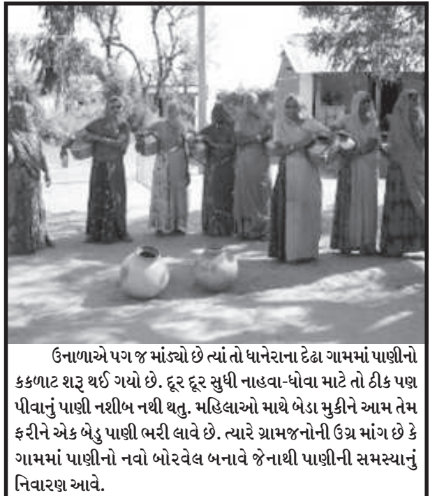
ઉનાળાએ પગ જ માંડ્યો છે ત્યાં તો ધાનેરાના દેઢા ગામમાં પાણીનો કકળાટ શરૂ થઈ ગયો છે. દૂર દૂર સુધી નાહવા-પોવા માટે તો ઠીક પણ પીવાનું પાણી નથી બચી થતું. મહિલાઓ માથે બેડા મુકીને આમ તેમ ફરીને એક બેડુ પાણી ભરી લાવે છે. ત્યારે ગ્રામજનોની ઉચ્ચ માંગ છે કે ગામમાં પાણીનો નવો બોરવેલ બનાવે જેનાથી પાણીની સમસ્યાનું નિવારણ આવે.