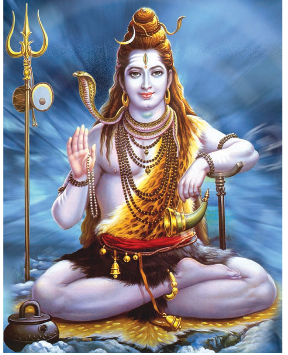
હર હર મહાદેવ - મહા શિવરાત્રીના પાવન પર્વે કલ્યાણના દેવ મહાદેવના ચરણોમાં પ્રાર્થના કરીએ... વ્યક્તિ જીવનથી લઈ વૈશ્વિક જીવન કલ્યાણમય બને... ભોળો નાથ સૌના મનોરથ પૂર્ણ કરે એવી પ્રાર્થના સાથે સમગ્ર દેશમાં મહાશિવરાત્રીનું પર્વ ઉલ્લાસમય વાતાવરણમાં ઉજવાશે...

નવીદિલ્હી, તા. ૬ ગુજરાત બાદ હવે રાષ્ટ્રીય પાટનગર દિલ્હીમાં પણ હાઈએલર્ટની જાહેરાત કરવામાં આવી છે. કારણ કે, ઈન્ટેલીજન્સ સંસ્થાઓ દ્વારા ચેતવણી આપવામાં આવી છે કે, લશ્કરે તોઈબા અને જેશે મોહમ્મદના ત્રાસવાદીઓ દિલ્હીમાં ઘુસણખોરી કરી શકે છે. મિડિયા અહેવાલમાં જણાવવામાં આવ્યું છે કે, સુરક્ષા અધિકારીઓએ દિલ્હી પોલીસને માહિતી આપી છે કે, વાયા ગુજરાત મારફતે ભારતમાં પ્રવેશ કરી ગયેલા અને પાકિસ્તાનથી આવેલા શકમંદ ત્રાસવાદીઓ રાષ્ટ્રીય પાટનગરમાં પ્રવેશ કરી શકે છે. ઈન્ટેલીજન્સ સંસ્થાઓએ ચેતવણીમાં કહ્યું છે કે, આ શકમંદો માર્કેટમાં અથવા તો મોલમાં હુમલાને અંજામ આપી શકે છે. પોલીસે ભરતક વિસ્તારો અને સુરક્ષા સંસ્થાઓમાં સુરક્ષા વ્યવસ્થાને વધારે મજબૂત બનાવી દીધી છે. રાષ્ટ્રીય પાટનગર દિલ્હીમાં પહેલા પણ મોટા હુમલા થઈ ચુક્યા છે. ગુજરાતમાં નેશનલ સિક્યુરિટી ગાર્ડની બે ટીમો પહોંચી ચુકી છે. કેન્દ્ર સરકાર દ્વારા હાઈએલર્ટની જાહેરાત કરાયા બાદ આ ટુકડી પહોંચી હતી.