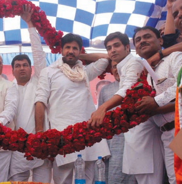
દાણીલીમડા ખાતે યુથ કોંગ્રેસ દ્વારા સ્વભાભિમાન રેલીનું આયોજન કરવામાં આવ્યું હતું. જેમાં પંજાબના અમરિન્દરસિંહ હાજર રહ્યા હતા.

ઈડર તાલુકાના ભેટાલી ગામની સીમમાંથી રવિવારે પસાર થઈ રહેલ એક જીપના ચાલકે રોંગ સાઈડે આવી એકટીવાને ટક્કર મારતા તેના ચાલકનું ગંભીર ઈજાને કારણે મોત નિપજ્યું હતું. જે અંગે જાદર પોલીસે ગુનો નોંધી આગળની કાર્યવાહી હાથ ધરી છે. ગત રવિવારે જીપ નં. જીજે.૯.એમ. ૬૮૧૬ ના ચાલક ભેટાલીની સીમમાંથી રોંગ સાઈડે આવી એકટીવા નં. જીજે.૯.સી.એફ. ૬૦૩૦ને ટક્કર મારી હતી. જેના કારણે ઈડર તાલુકાના ભવેલ ગામના મિલિન્દકુમાર કાંતીભાઈ પટેલને ગંભીર ઈજા થતાં તેમને સારવાર માટે મળે તે પહેલા જ મોત નિપજ્યું હતું.