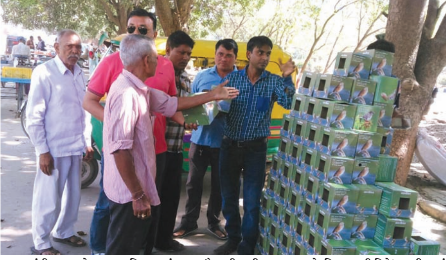
ગાંધીનગર શહેરના ઘ-૪ વિસ્તારમાં બટાકાપોઆની લારી ચલાવતા અને 'વિશ્વ ચકલી દિને' ચકલી ઘરનું વિતરણ કરતા યુવાનને ત્યાં આજે સવારથી જ મોટી સંખ્યામાં પશ્ચિમીઓ આવી પહોંચ્યા હતા. ચકલીઘર લઈને જતા પ્રેમીઓએ આ યુવાનની સેવાને બિરદાવી હતી. તો કેટલાક સેવાભાવી નગરજનોએ યુવાનને દાનની ઓફર કરી હતી. જે યુવાને નિસ્વાર્થભાવે ઢુંકરાવી હતી. સવારથી બપોર સુધીમાં અંદાજીત ૫૦૦થી વધુ ચકલીઘરનું વિતરણ યુવાને કર્યું હતું.

ભાજપ વર્તુળો પાસેથી પ્રાપ્ત વિગતો મુજબ પ્રદેશ સંગઠન માળખામાં ધરખમ ફેરફારો તોળાઈ રહ્યા છે. નવા પ્રદેશ પ્રમુખ પોતાની નવી ટીમ કેટલાક ભાજપના જુના જોગીઓને પાછા લાવે અને સ્થાન આપે તેવી શક્યતા સેવાઈ રહી છે. સાથેસાથ પ્રદેશ મોરચાઓમાં પણ કેટલાક મહત્વના ફેરફારો કરીને કેટલાક યુવા ચહેરાઓને સ્થાન આપવામાં આવે તેવી શક્યતા છે.