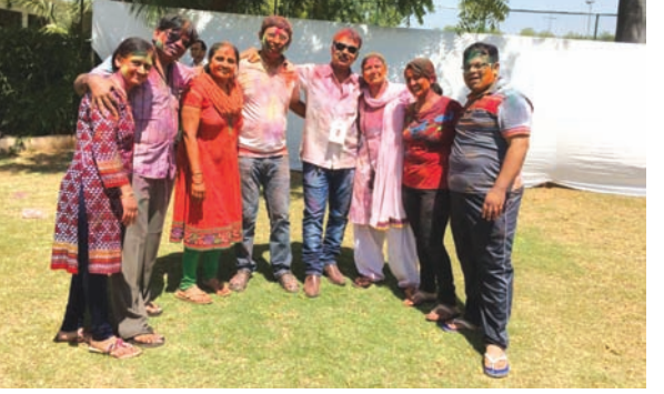
ગાંધીનગરમાં પર ઉલ્લાસ ઉમંગ છવાઈ ગયો હતો.

હોળી-ધૂળેટી પર્વની ઉજવણી કરતા હતા. હોળીના તહેવારે જનહૃદયમાં આનંદના તરંગો લહેરાતા