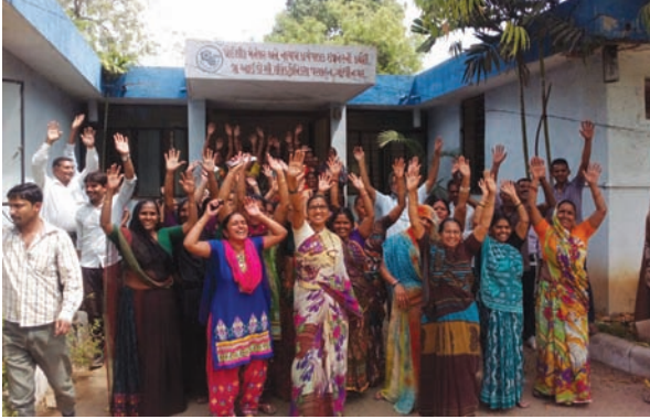
મુલાકાત લઈ તેમના પ્રશ્ન અંગે રજૂઆત કરી હતી. અંગે ઉલ્લેખનીય છે કે તાજેતરમાં પાણી આપવાનું વચન આપવામાં આવ્યું હતું. આમ છતાં આ વસાહતના રહીશોને નર્મદાનું તો દીક

જીઆઈડીસી ખાતેની નાયબ વિધાનસભામાં મુખ્યમંત્રી કાર્યપાલક ઈજનેર કચેરીએ પણ આનંદીબેન પટેલ દ્વારા નર્મદાનું પરંતુ પાણી જ ના આવતા ઇવટે ઉઝા રજૂઆતનો આશરો લેવો પડયો હતો. આજે આશરે ૧૧ વાગ્યાના સુમારે આ વસાહતના રહીશો એકત્ર થઈ ઈલેક્ટ્રોનિક્સ જીઆઈડીસીના ગેઝિયાની ઓફિસે પહોંચ્યા હતા. જયાંથી તેમને જીઆઈડીસી ખાતેની નાયબ કાર્યપાલક ઈજનેરની કચેરીએ મોકલવામાં આવ્યા હતા. નાયબ કાર્યપાલક ઈજનેરની કચેરીએ રજૂઆત કર્યા બાદ વસાહતીઓને સંતોષ ના થતા ઇવટે તેમણે સે-૧૬ માં પાટનગર યોજના ભવન ખાતે અધિકારીઓને મળી પાણીના પ્રશ્નની રજૂઆત કરવાનું મુનાસિબ માન્યું હતું. આથી આખું