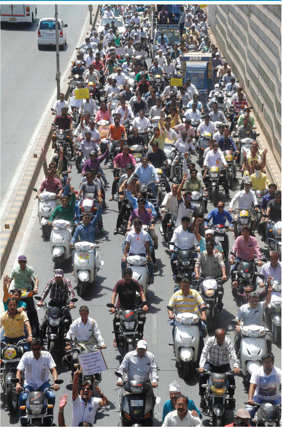
જવેલર્સ એસોસિએશન દ્વારા ટુ વ્હીલર અને ફોર વ્હીલરની રેલીનું આયોજન કરવામાં આવ્યું હતું.

hello ફેન્ડ્સ! ● ૪ પાનાનું ચાલુ... વિચારો બદલો તો વધુ બદલાઈ જશે. વહેતા સમયની સાથે પરિવર્તન અવશ્ય આવ્યું છે, છૂટછાટ મળી છે પણ તોય અમુક પ્રશ્નો પનો નથ મુકતા તે નથી જ મુકતાં. સમાજની શરમા શરમીએ દેખાદેખીમાં હજીએ ઘણી વાતો ભલે જાહેરમાં ડાહી ડાહી વાતો કરતાં હોય, ખાનગીમાં તો જે તે પરિવારમાં એમનાં રૂઢિચુસ્ત વિચારો ઠીકી જ બેસાડતાં હોય છે!! ચૂંટલો : કોઈ કુંવારી છોકરીને એના પોતાના રંગ, રૂપ, બોડી સ્ટ્રક્ચર, ડ્રીઝી, આર્થિક પરિસ્થિતિને કારણે વર શોધવામાં તકલીફ પડતી હોય, વિન્નો આવતાં હોય, માનસિકતા કાટ ખાઈ ગયેલી હોય તો શી રીતે કહી શકાય કે સમાજ સુધર ગયા હેં? જ્યારે પાણી માથાથી ઉપર વહેશે ત્યારે તેઓ એટલું જ ગાશે કે 'રિવાજો કી પરવા ના રસમાં કા ડર હેં, મેરી આંશિકી મુજહે સ ખબર હેં...'