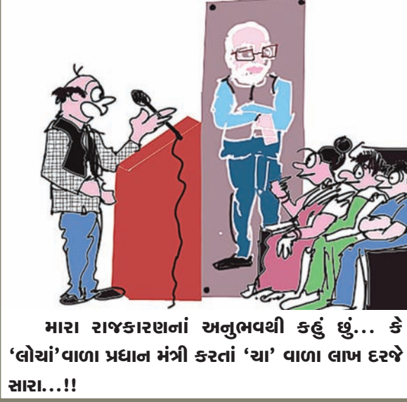
મારા રાજકારણનાં અનુભવથી કહું છું... કે 'લોચા'વાળા પ્રધાન મંત્રી કરતાં 'ચા' વાળા લાખ દરખે સારા...!!