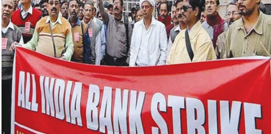
નવી દિલ્હી, તા. ૨૮ નોટબંધી દરમિયાન વધારાના કામ કરવા માટે બેંક કર્મચારીઓને વળતર આપવા અને અન્ય શ્રેણીબદ્ધ માંગને લઈને આજે જાહેર ક્ષેત્રના બેંક કર્મચારીઓ હડતાળ પર ઉતરી જતા બેંકિંગ સેવાને માઠી અસર થઈ હતી.

૨૨૦૦૦ કરોડની આસપાસના ૪૦ લાખ ચેકના કિલિયરન્સને અસર : જુદી જુદી માંગણીઓને લઈને ૧૦ લાખથી વધુ કર્મચારીઓએ એક દિવસની હડતાલ પાડી