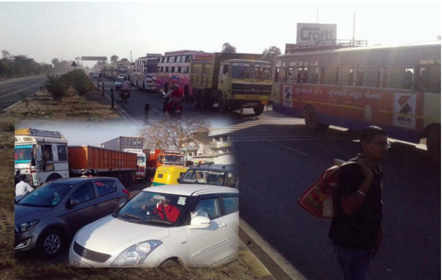
સાબરકાંઠા જિલ્લાના નેશનલ હાઈવે આઠ પ્રાંતિજના મજરા ચોકડી પાસે નવીન રોડનું કામ ચાલુ હોવાને લઈને એક કિલોમીટર સુધી ટ્રાફિકજામની સ્થિતિ સર્જાઈ. વાહનોની લાંબી-લાંબી કતારો જોવા મળી હતી.

બાદ જૂનું મંદિર હટાવી દેવું. જેમાં નેશનલ હાઈવેના કામને કારણે મૂડી માનવામાં આવ્યું હતું. મંદિરનું બાંધકામ શરૂ થયું ત્યારે ખોટી દિશામાં મુખ બનાવેલ છે. જે મંદિરની હજી પ્રતિષ્ઠા થયેલ નથી. હાલ મંદિરની જગ્યામાં ૫૦ ગાયો છે. તેમજ અન્ય પ્રાણીઓ છે. છેલ્લા આઠ મહિનાથી ગ્રામ પંચાયત દ્વારા મંદિરનું પાણી બંધ કરાયેલ છે. વધુમાં ગાયોના ઘાસચારા માટે હોલ બનાવેલ છે. જેને તોડી નાંખવા માટે સરપંચે વારંવાર નોટીસો આપી છે. સરપંચે મારા પર ગાંજાનો જે આરોપ લગાવ્યો છે તે તદ્દન ખોટો છે.