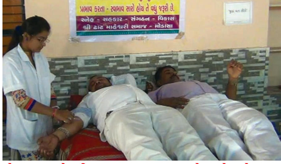
મોડાસાના મહેશ્વરી સમાજ દ્વારા રક્તદાન કેમ્પ યોજાયો અરવલ્લી જિલ્લાના મોડાસા શહેરમાં મહેશ્વરી સમાજ (મારવાડી) શ્રુપ દ્વારા મહેશ્વરી સમાજવાડી ખાતે રક્તદાન કેમ્પનું આયોજન કરવામાં આવ્યું હતું. જેમાં સમાજના ૧૦૦થી વધુ વ્યક્તિઓ દ્વારા રક્તદાન કરી રક્તદાન જરૂરીયાતમંદ અને જાનલેવા બીમારીઓ સાથે લડતા વ્યક્તિઓને મદદરૂપ બનવાનો અથાગ પ્રયત્ન હાથ ધર્યો હતો. રક્તદાન કેમ્પમાં મહેશ્વરી સમાજના અગ્રણીઓ સાથે મોડાસા લાયન્સ ક્લબના હોદ્દાદારો ઉપસ્થિત રહી રક્તદાન કર્યું હતું. મારવાડી સમાજ વેપારી સમાજ તરીકે સમગ્ર દેશમાં જાણીતો છે ત્યારે વેપાર સાથે નવયુવાન સમાજના યુવાઓએ રક્તદાન કરી સમાજસેવાની પહેલ કરી હતી.

ગામડાઓમાં ટીવી તો ઠીક વીજળી પણ ન હતી ત્યારે પેટ્રોમેકસના અજવાળે ભવાઈના નાટકોમાં તેના નાયક કલાકારો પૂરુષ અને સ્ત્રી પાત્ર પણ પુરુષો જ ભજવીને પાત્રોને અદભુત ન્યાય આપી લોકોમાં મનોરંજન કરાવતા હતા ત્યારે તે જમાનાની કલા અને ભવાઈ પણ જીવંત રાખીને ગામડાઓમાં આવી નાયક ભાઈઓ ગીત સંગીતના ટાપ્પા સાધનોથી પણ લોકોને પેટ પકડી હસાવતા લોક રંજન અને લોક શિક્ષણ આપતા હતા. રંગલા-રંગલીના પાત્રો હાસ્યની સરવાણી વહાવતા જોવાનો પણ આ નાટકોમાં હલાવો લેવાય વડીલો પણ એ મના જમાનાની યાદ તાજી કરવા ભવાઈ જોવાનું ચુક્યા ન હતા.