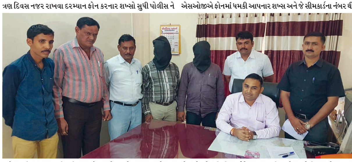
પહોંચવાની સફળતા મળી હતી. ઝડપાયેલા બંને શખ્સો મુળ ઉત્તરપ્રદેશના છે અને બંને મુંબઈના ગોવર્ડી વિસ્તારના બેંગનવાડીમાં રહેતા હતા.