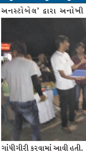
ગાંધીગીરી કરવામાં આવી હતી. રવિવારે હોળીના દિવસે સાંજે ૫

કરવાનો અનોખો પ્રયોગ હાથ ધર્યો હતો. આ પ્રયોગને કેન્દ્રિય મંત્રી પુરુષોત્તમ રૂપાલાએ ઉપસ્થિત રહી બિરદાવતા યુવાનોનો ઉત્સાહ બેવડો થઈ જવા પામ્યો હતો. 'યુવા અનસ્ટોપેબલ' નામથી શહેરના કેટલાક યુવાનો ગાંધીનગરમાં વિવિધ સેવાકીય તથા રચનાત્મક પ્રવૃત્તિ કરી રહ્યાં છે. આ ગુપ્તના યુવાનો સમાજસેવા સાથે અવનવા ક્રિમિયા દ્વારા વિવિધ મુદ્દે સમાજને જાગૃત કરવાનો પણ પ્રયાસ કરે છે. આ વખતે હોળીના પર્વને અનુલક્ષીને 'યુવા