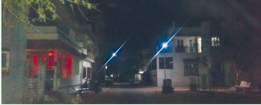
લાઈટના ઓજસથી શહેર ઝગમગતું થવાને બદલે અંધકારમાં ગરકાવ થઈ ગયું છે.

એલઈડી લાઈટો ફીટ કરવામાં આવી છે. શહેરમાં એલઈડી જેને પગલે અંધકારનો લાભ લઈને ચોર ઈસમોને મોકળું બાળકો તેમજ મહિલાઓ ઘરની બહાર નીકળતા પણ ડર થયા કરે છે પરંતુ અનેકવાર ફરીયાદ કરવા છતાં રીપેર કરવા કોઈ ડોકટર નથી. નાગરીકોને લાઈટ રીપેરીંગનો કોન્ટ્રાક્ટ આપવામાં આવ્યો છે તેમને કહો તે રીપેર કરી જશે તેવું સાંભળવા મળે છે. ત્યારે સેક્ટર-૭ સી જેવી જ પરિસ્થિતી સેક્ટર-૩ બી અને સે-૩ ન્યુંમાં ઉભી થવા પામી છે. આ બંને સેક્ટર સાંજ ૬ થતાં જ અંધકારમાં ગરકાવ થઈ જાય છે. ત્યારે તંત્ર દ્વારા એલઈડી લાઈટના ઓજસ સેક્ટરની શેરીઓમાં પથરાય તેની રાહ નાગરીકો જોઈ રહ્યા છે.