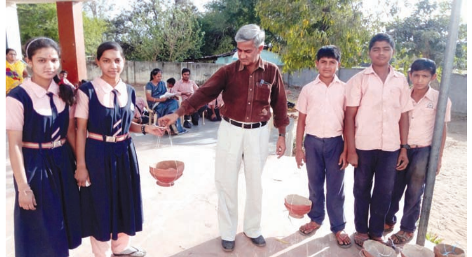
બાળકો દ્વારા જૂના વેસ્ટ પુઠાના બોક્સમાંથી ચકલીઘર બનાવ્યા હતા અને તેને શાળા સંકુલમાં લગાડ્યા

લીંબોદરાની પી.પી.આર. શાહ હાઈસ્કૂલ ખાતે આ દિવસ અંતર્ગત વિદ્યાર્થીઓએ જૂના માટલા એકઠા ચકલીઘરમાં અનેક પક્ષીઓએ માળા