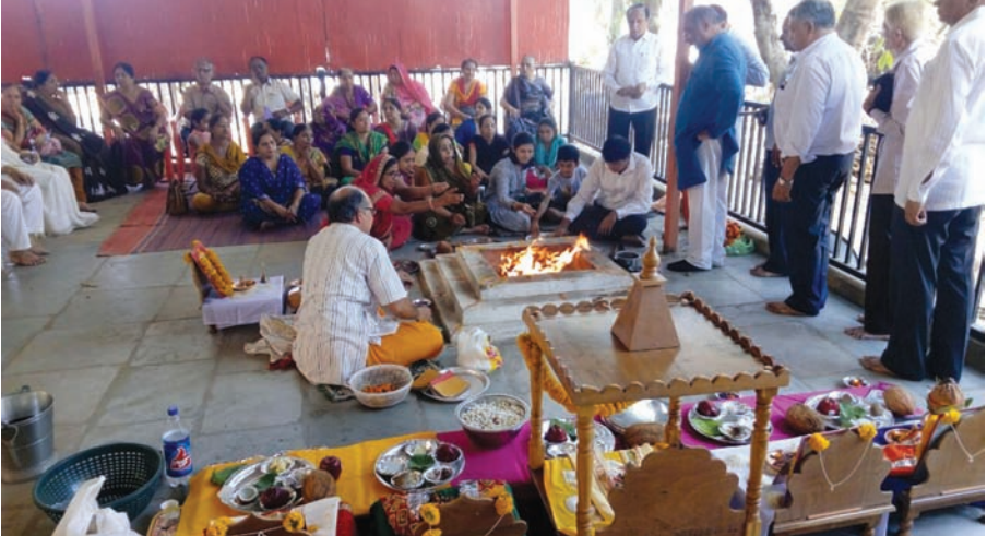
ગાંધીનગર શહેરના સુપ્રસિદ્ધ જલારામ ધામ ખાતે આજે દરીયાલાલ જન્મજયંતિ પ્રસંગે હવનનું આયોજન કરવામાં આવ્યું હતું. જલારામ મંદિર સે-૨૯ ખાતે સવારે ૮.૩૦ કલાકે હવનનો પ્રારંભ કરાયો હતો. જેમાં મોટીસંખ્યામાં ભાવિ ભક્તો હાજર રહ્યા હતા. જયારે બપોરે ૧૨.૩૦ કલાકે શ્રીફળ લોમાયા બાદ ભક્તોએ મોટીસંખ્યામાં મહાપ્રસાદનો લાભ લીધો હતો.