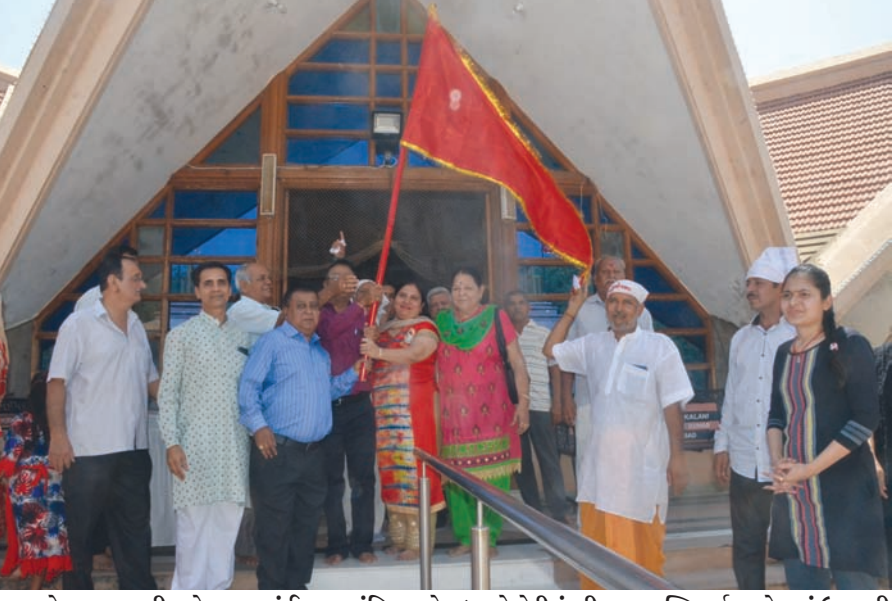
સેક્ટર-૩૦ શ્રી જૂલેલાલ - સાઈબાબા મંદિર ખાતે બુધવારે ચેટીચંડની ભાવભક્તિપૂર્ણ માહોલમાં ઉજવણી કરાઈ હતી. જૂલેલાલના પૂજા બહેરાણા સાહેબની જ્યોત પ્રગટાવાઈ હતી અને ધજા ચડાવાઈ હતી.