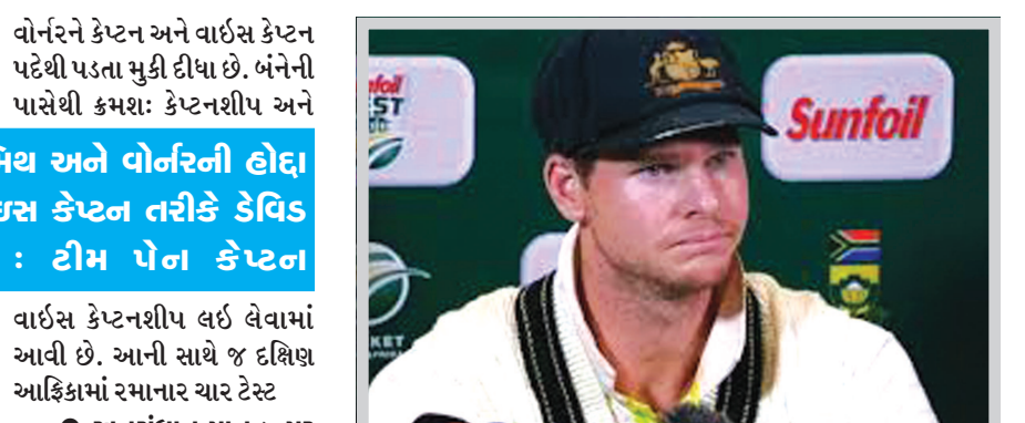
વોર્નરને કેપ્ટન અને વોર્નરને કેપ્ટન પદથી પડતા મુકી દીધા છે. બંનેની પાસેથી કમશ : કેપ્ટનશીપ અને

એકવાર સપાટી ઉપર આવી જતાં બળભાગટ મચી ગયો છે. કરોડો ક્રિકેટ ચાહકો આઘાતમાં ગરકાવ થઈ ગયા છે. કારણ કે દુનિયાના મામલામાં ફસાયા છે. ગુનાની કબૂલાત કરી લીધા બાદ ઓસ્ટ્રેલિયાએ તરત કાર્યવાહી કરીને સ્ટિવ સ્મિથ અને ડેવિડ