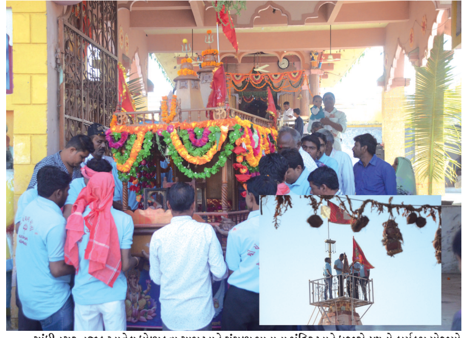
ગાંધીનગર નજીક આવેલ ધોળાકુવા ગામ ખાતે ચંચળા માતાના મંદિર ખાતે ધજારોહણનો કાર્યક્રમ યોજાયો હતો. ચંચળા માતાનું મંદિર વર્ષો જુનું છે તેમજ ગ્રામજનો માટે આસ્થાનું કેન્દ્ર સમાન છે. જ્યારે દર ચૈત્રી માસમાં ધજારોહણનો કાર્યક્રમ યોજાય છે. જેને પગલે ધોળાકુવા ગામમાં ભવ્ય વરઘોડો નીકળ્યો હતો. વરઘોડામાં માતાજીના ગુણગાન ગાતા ગાતા ભકતો ઝુમી ઉઠ્યા હતા. ગામની શેરીઓ તેમજ મહોલ્લામાં ફરીને શોભાયાત્રા મંદિરે પહોંચી હતી. ચંચળા માતાજીના ધજારોહણ પ્રસંગે ગ્રામજનો મોટીસંખ્યામાં હાજર રહ્યા હતા.