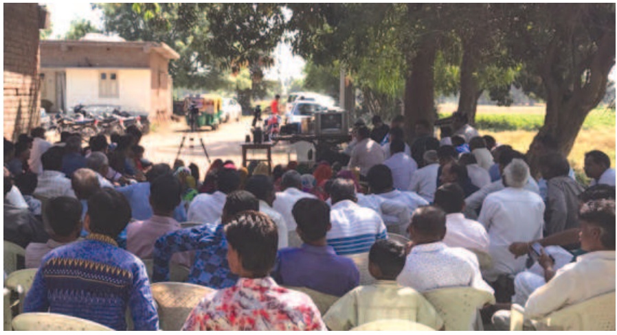
વડાપ્રધાન નરેન્દ્ર મોદી દ્વારા ૪૨મી 'મન કી બાત' કાર્યક્રમમાં ગાંધીનગર જિલ્લાનું રાયપુર ગામ ચમક્યુ હતુ. રાયપુર ગામે ખેતનાર છેડે એકામાં ટી.વી. મુકી ઘઉંની લણણી કરતા મજૂરોએ અને ખેડૂતોએ આ મનકી બાતનો કાર્યક્રમ માણ્યો હતો. ગુજરાત કિસાન મોરચાના અગ્રણી હિતેન્દ્ર પટેલે આ મુદ્દે તેમના વતનનો ઉલ્લેખ કરવા માટે વડાપ્રધાન પ્રત્યે આભારની લાગણી વ્યક્ત કરી જણાવ્યું છે કે જગતનો તાત કૃષિના કામ વચ્ચે પણ વડાપ્રધાનને સાંભળવા ઉત્સુક છે તેનો પુરાવો આજનો કાર્યક્રમ છે. તેમણે જણાવ્યું છે કે સાનુકૂળ વાતાવરણને પગલે ઘઉંનું સારૂ ઉત્પાદન અને સરકાર દ્વારા ખેડૂતોના હિતમાં ટેકાના ભાવે શરૂ થયેલી ખરીદી પછી જિલ્લામાં ખેડૂતોમાં ઉત્સાહ બેવડાયો છે.

સંપન્ન કરાઈ હતી. અત્રે ઉલ્લેખનીય છે કે જુની સાંકળી ગામ પૂર્વમંત્રી સવ. સવજીભાઈ કોરાટની જન્મ અને કર્મભૂમિ છે.