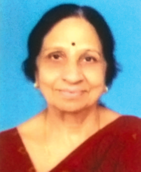
જયુબેન ૬૬૬૨ અગ્રણી, મહિલા પાંખ, સિનિયર સિટિઝન્સ કાઉન્સિલ અને ગાયત્રી પરિવાર