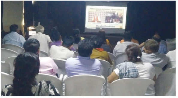
ચિલોડા સ્થિત કેશવ હોલના હોટલમાં મેરા બુથ સભસે મજબુત અંતર્ગત પ્રધાનમંત્રી દ્વારા વિડીયો કોન્ફરન્સના માધ્યમથી ભારતીય જનતા પાર્ટીના કાર્યકર્તા સાથે સંવાદ યોજવામાં આવ્યો હતો. આ કાર્યક્રમમાં ચિલોડા વિસ્તારના ભાજપના અગ્રણીઓ તથા કાર્યકરો ઉપસ્થિત રહ્યા હતા.