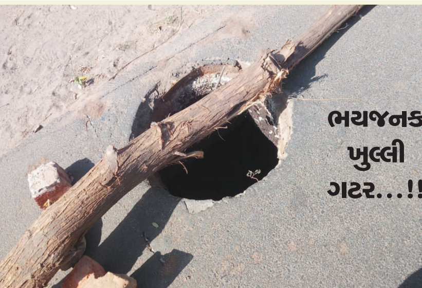
શહેરના મુખ્ય માર્ગ ઘ રોડ પર કલેક્ટર કચેરી સામેથી ઉમા સમાજ ભવન તરફ સેક્ટર-૧ ૨ માં જવાના માર્ગ પર ભયજનક હાલતમાં ખુલ્લી ગટર જોવા મળી રહી છે.

ગાંધીનગર, તા.૨ મહાશિવરાત્રી તા. ૪-૨-૨૦૧૯ને સોમવારના રોજ સંસ્કાર ગૃપ દ્વારા શિવરાત્રી નિમિત્તે પૂજા અર્ચના તથા ધૂપ-દિપ આરંધના ફરાળ સાથે સેક્ટર-૭ બગીચો, સુવિધા કચેરી પાસે સવારે ૮.૪૫ થી ૧૦ કલાક દરમિયાન કરવામાં આવશે. શહેરના મુખ્ય માર્ગ ઘ રોડ પર કલેક્ટર કચેરી સામેથી ઉમા સમાજ ભવન તરફ સેક્ટર-૧ ૨ માં જવાના માર્ગ પર ભયજનક હાલતમાં ખુલ્લી ગટર જોવા મળી રહી છે. ટ્રાફિકથી અત્યંત વ્યસ્ત એવા આ માર્ગ પર ખુલ્લી ગટરના કારણે ઉમિયા કેમ્પસના યુવા વિદ્યાર્થીઓ તેમજ ઉમિયા મંદિરે દર્શનાર્થે આવતા વડિલો સહિતના રાહદારીઓ અને વાહનચાલકોના માથે અકસ્માતનો ખતરો બનવા પામેલ છે.