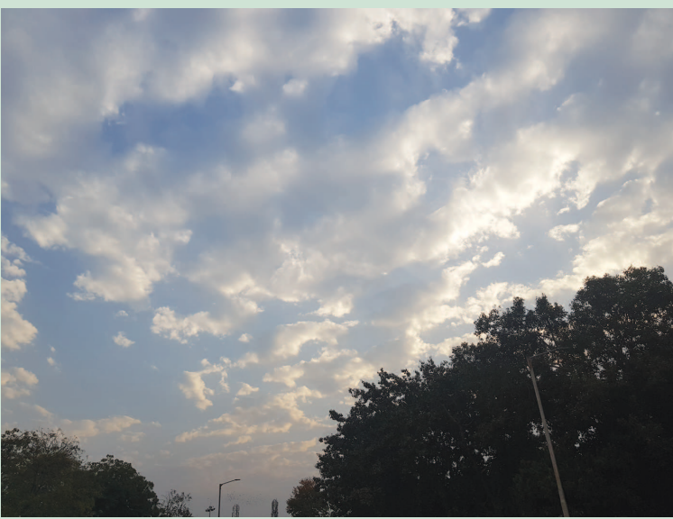
કમોસમી વરસાદ સાથે બરફના કરા પડવા સાથે મોસમમાં ગજબ પલ્ટો જોવા મળી રહ્યો

કેરી રસિયા નગરજનો પણ ચિંતિત બન્યા છે. વાદળોની હાજરીને કારણે શહેરમાં ઠંડકનું વાતાવરણ સર્જાયું છે. જેના પગલે ફરી એકવાર મચ્છર જેવા રોગજન્ય જીવાણુઓનો ઉપદ્રવ વધ્યો છે તેમજ શરદી, તાવ, ખાંસી, શરીર તુટવું માથાનો દુઃખાવો, ઝાડા ઉલ્ટી જેવી બીમારીઓના દર્દીઓ દવાખાનામાં મોટી સંખ્યામાં જોવા મળી રહ્યા છે. વળી મહત્તમ તાપમાન પણ ૩૪.૫ ડિગ્રી જેટલું હોવાથી લઘુત્તમ અને મહત્તમ તાપમાનમાં ૨૩ ડિગ્રી જેટલો મોટો ગાળો સર્જાયો છે જેથી શહેરની જમીનના શરીરને વાતાવરણ સાથે અનુકૂળન સાધવું મુશ્કેલ પડી રહ્યું છે. શહેરમાં બાળકોમાં ખાંખાં આવવાના કિસ્સા પણ જોવા મળી રહ્યા છે.