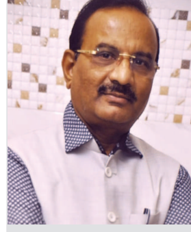
એસ એસ પટેલ