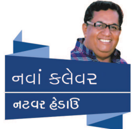
નવાં કલેવર નટવર હેડાઈ

લઈ શકાઈ તો શું થયું. રોટલીઓ તો મળી જ ને. બહેન પોતાની સફળતા પર ખુશ હતી. વેઈટર સ્તબ્ધ ઊભો રહી ગયો. છાંકરાઓ ખુશ થતાં કચરામાંથી રોટલીઓ શોધતા હતા. અને તેને એમ લાગતું હતું કે હોટેલની આગળ પોર્ચમાં જાનેયાઓ જાણે નાચી રહ્યાં છે અને તેમના હાથમાં નોટોની જગ્યાએ રોટલીઓ હવામાં ઉછાળી રહ્યાં છે અને જાણે કે કેટલાંય બાળકો હવામાં ઊછળતી એ રોટલીઓને ભૂખી નજરે જોઈ રહ્યાં છે. તેને ગામડામાં રહેલા પોતાના બાળકો યાદ આવ્યા. ભારે પગલે તે પાછો વળ્યો. છેવટ તેને પણ તેમનાં માટે બે ટાઈમની રોટલીની વ્યવસ્થા કરવાની છે ને!