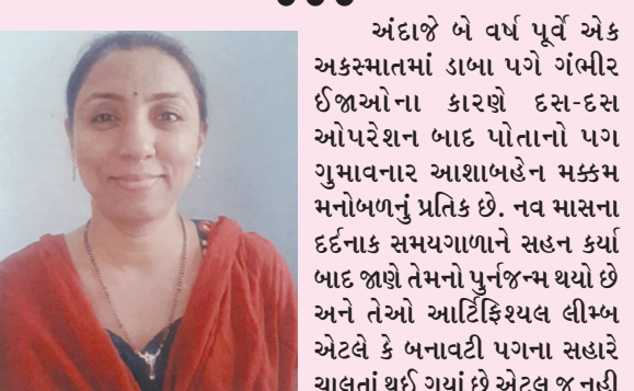
ફરીથી સેક્ટર-૨ માં સ્વામિનારાયણ શિક્ષણ વિદ્યાલયમાં કાર્યરત પણ થઈ ચુક્યા છે.