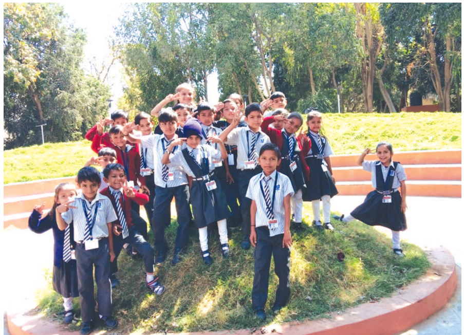
જેએમપી ગોપાલક વિદ્યા સંકુલના પ્રાથમિક વિભાગના વિદ્યાર્થીઓને સેક્ટર-૨ ૮ના બાલોદ્યાનની મુલાકાતે લઈ જવામાં આવ્યા હતા. અહીં તેમને વનભોજન કરાવી વિવિધ રમતો પણ રમાડવામાં આવી હતી.