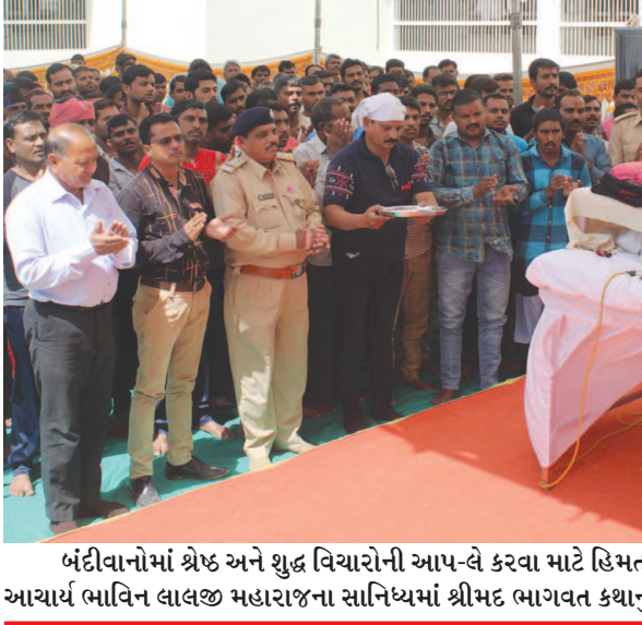
બંદીવાનોમાં શ્રેષ્ઠ અને શુદ્ધ વિચારોની આપ-લે કરવા માટે હિમતનગરની સબજેલમાં સાત દિવસ માટે આચાર્ય ભાવિન લાલજી મહારાજના સાનિધ્યમાં શ્રીમદ ભાગવત કથાનું આયોજન કરવામાં આવ્યું છે,

અરવલ્લી જિલ્લાના બિલોડા તાલુકાના વાંકાનેર ગામમાં મહા શિવરાત્રીના પાવન પર્વ નિમિત્તે વાંકાનેર ગામ પાસે આવેલ ડુંગરની તળેટી નજીક ઝાંઝરી વિસ્તારમાં અંતિ પ્રાચિન પૌરાણિક વાવ પાસે શિવજીના મંદિરમાં ભાવિક ભક્તોએ પુજા અર્ચના કર્યા બાદ મહા પ્રસાદી અને ફરાળનો લાભ મેળવી ધન્યતા અનુભવી હતી.