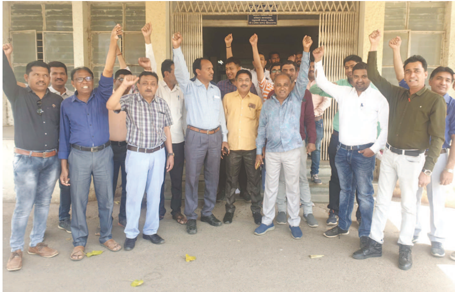
હિમતનગર સહીત સાબરકાંઠા જિલ્લામાં શુક્રવારે વર્ગ-૩ ના ૩૦૮ મહેસુલી કર્મચારીઓ પડતર માંગણીઓને લઈને માસ સીએલ પર ઉતાર્યા હતા અને હિમતનગરની બહુમાળી કચેરી આગળ સુરોચ્યાર કાર્યા હતા.