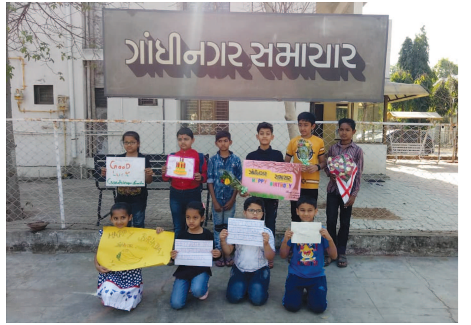
સંસ્કાર શુભના બાળકો ગાંધીનગર સમાચારના જન્મદિનની પૂર્વ સંધ્યાએ ગાંધીનગર સમાચારની મુલાકાતે આવ્યા હતા. બાળકોએ ખૂબ જ ઉત્સાહપૂર્વક વિવિધ ચિત્રો બનાવ્યા હતા અને કચેરીને અર્પણ કર્યા હતા.