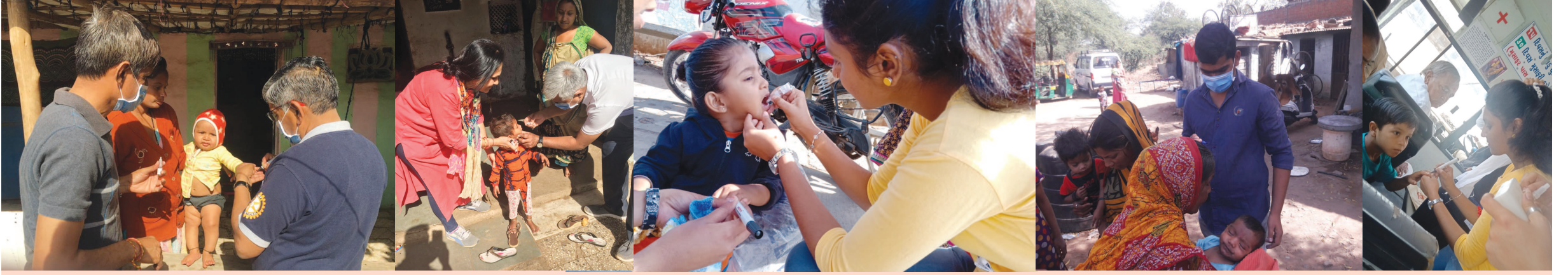
પલ્સ પોલિયો અભિયાન અંતર્ગત રોટરી ક્લબ ઓફ ગાંધીનગર દ્વારા શહેરના વિવિધ વિસ્તારોમાં, સેવા વસ્તીમાં પલ્સ પોલીયોના ટીપા પીવડાવવામાં આવ્યા હતા. રોટરી ક્લબના સભ્યોએ આ અભિયાન અંતર્ગત સઘન કામગીરી કરી હતી.