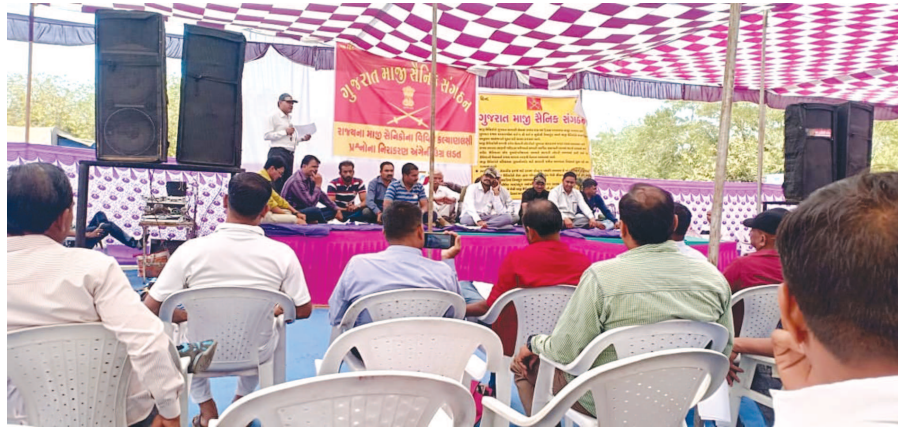
શહેરની સત્યાગ્રહ ઇલાવણી ખાતે ગુજરાત માજી સૈનિક સંગઠનના હોદ્દેદારો અને સભ્યો મોટી સંખ્યામાં આવી પહોંચ્યા હતા. રાજ્યના માજી સૈનિકોના વિવિધ કલ્યાણલક્ષી પ્રશ્નોનું નિરાકરણ નહીં આવતા માજી સૈનિકોએ સત્યાગ્રહ ધરણા યોજી સરકાર સામે વિરોધ પ્રદર્શિત કર્યો હતો.