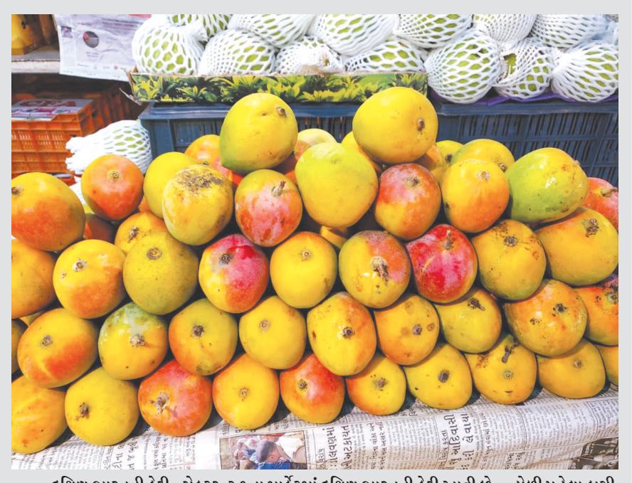
દક્ષિણ ભારતની કેરી - સેક્ટર-૨ ૧ના માર્કેટમાં દક્ષિણ ભારતની કેરી આવી છે... હોળી પહેલા કચી કેરી પણ કોઈ ખાય નહિ પણ બદલાતા સમય, સંજોગોમાં હવે લગન પ્રસંગોમાં કેરીનો રસ પણ પીરસાય છે અને દક્ષિણ ભારતની કેરીનું ધૂમ વેચાણ પણ થાય છે... એક અહેવાલ મુજબ સેક્ટર-૨ ૧માં ૨૦૦ કિલોથી વધુ કેરી વેચાઈ છે...

ગાંધીનગર, તા. ૧૩ ગાંધીનગર જિલ્લામાં રવિ સીઝનના વાવેતરમાં સાનુકૂળ હવામાન રહેતાં રાયડો, ઘઉં અને બટાટાનું વિક્રમી ઉત્પાદન થવાના અંદાજ છે. જિલ્લામાં સતત અને સર્ળગ ઈડીનો માહોલ જળવાઈ રહેતાં બટાટાના ઉત્પાદનમાં તો એક બટાટાનું બે થી ત્રણ કિલો વજન ધરાવતા બટાટા પણ માણસા પંથકમાં મળ્યા હોવાનું જાણવા મળેલ છે. આ ઉપરાંત રાયડાના પાકમાં પણ આ વખતે સાડાં એવુ હેક્ટરટીક ઉત્પાદન મળશે તેવું ખેડૂતો સાથેની વાનગીતમાંથી જાણવા મળ્યુ છે. ઘઉં જે જિલ્લાનો મુખ્ય પાક છે તેનું પણ આ વખતે વિક્રમી ઉત્પાદન જોવા મળી રહ્યું છે. બીજી તરફ સરકાર દ્વારા ઘઉંના ઉત્પાદનની પણ ટેકાના ભાવે ખરીદી કરવાની કરાયેલી જાહેરાત પછી ખેડૂતો દ્વારા આ રજીસ્ટ્રેશનની કામગીરી પણ આરંભી દેવામાં આવી છે. રવિ ઉત્પાદનના સારા સમાચાર પછી ખેડૂતોએ પાણીની ઉપલબ્ધિને નજરમાં રાખી ઉનાળુ વાવેતરનો પણ પ્રારંભ કરી દીધો છે. જોકે આ વખતે ખેડૂતો દ્વારા ઘાસચારાનું વાવેતર કરવાનો ટ્રેન્ડ જોવા મળી રહ્યો છે. મળતી વિગતો પ્રમાણે જિલ્લામાં અત્યાર સુધીમાં ૨૯૦૦ હેક્ટરમાં ઉનાળુ પાકોનું વાવેતર નોંધાયુ છે. જેમાં ૧૭૮૨ હેક્ટરમાં ઘાસચારો, ૪૦૦ હેક્ટરમાં શાકભાજી, ૨૪ હેક્ટરમાં મગફળી અને ૬૦૦ હેક્ટરમાં બાજરીનું વાવેતર થયુ છે. જોકે વાતાવરણમાં છેલ્લા બે દિવસથી આવેલા પટાને પગલે ઉનાળુ પાકોના વાવેતરમાં થોડીક બ્રેક લાગી છે. જોકે પાણીની અછતને કારણે આ વખતે ઉનાળુ પાકના વાવેતર વિસ્તારમાં ઘટાડો થવાની સંભાવનાઓ પણ જોવા મળી રહી છે.