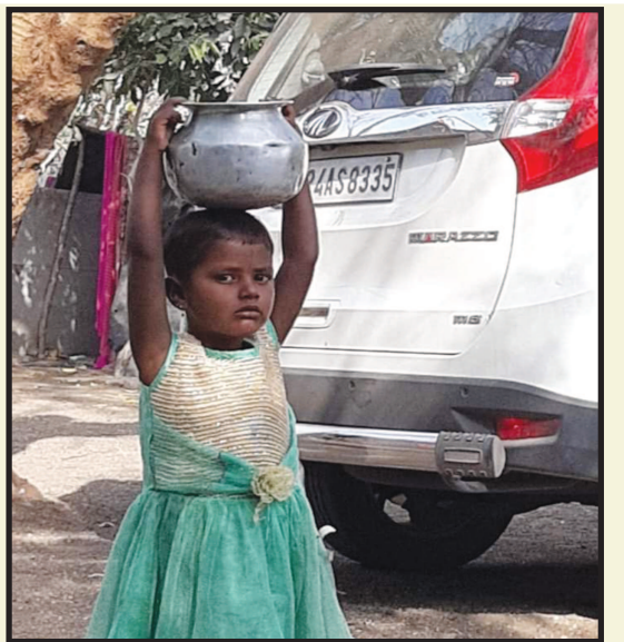
‘પ, પાણીનો પ...’ પાણી એ સૌની પાયાની જરૂરિયાત છે, પહેલાં ધોરણમાં ભણવા જતાં પહેલાં આ ઢબુડી સવારે ઘરનું માટલું ભરવા માને મદદ કરે છે. રસ્તે જતાં એ મોટી કાર સામે જોઈ એટલાં માટે અચરજ પામે છે કે અહીં એક માટલું ભરવા ચાર ફેરા કરવા પડે છે અને આ સાહેબ ચાર ઘેડાની કારને પાણીની નળીથી નવડાવે છે..!