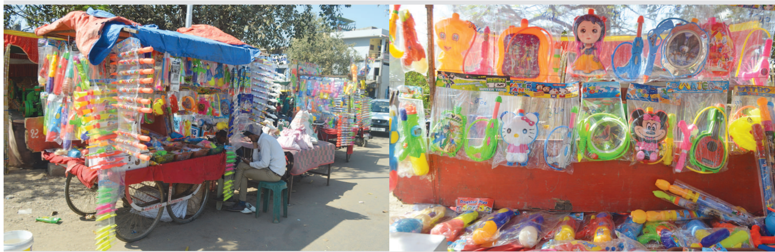
હોળીનો તહેવાર નજીક આવી રહ્યો છે ત્યારે શહેરના માર્કેટમાં વિવિધ પ્રકારની પિચકારી અને રંગબેરંગી ગુલાલ જોવા મળી રહ્યા છે.