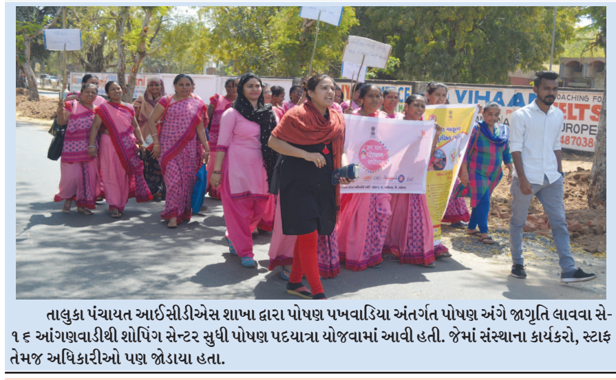
તાલુકા પંચાયત આઈસીસીએસ શાખા દ્વારા પોષણ પખવાડિયા અંતર્ગત પોષણ અંગે જાગૃતિ લાવવા સે-૧૬ આંગણવાડીશી શોપિંગ સેન્ટર સુધી પોષણ પટ્ટાચારા યોજવામાં આવી હતી. જેમાં સંસ્થાના કાર્યકરો, સ્ટાફ તેમજ અધિકારીઓ પણ જોડાયા હતા.