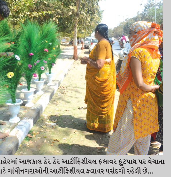
આટીકિશીયલ ફલાવર - શહેરમાં આજકાલ ઠેર ઠેર આટીકિશીયલ ફલાવર ફુટપાથ પર વેચાતા નજરે પડે છે... ઘરના સુશોભન માટે ગાંધીનગરનાઓની આટીકિશીયલ ફલાવર પસંદગી રહેલી છે...

ગાંધીનગર, તા. ૧૫ લોકસભાની સાથે રાજ્ય વિધાનસભાની ખાલી પડેલી પાંચ વિધાનસભા બેઠકોની યોજનાર ચૂંટણીને લઈ પંચ દ્વારા અલગથી તૈયારીઓ આરંભી દેવાઈ છે. આ પાંચેય વિધાનસભાની ખાલી બેઠકો માટેની જાહેરાત પંચ દ્વારા કરી દેવામાં આવી છે. આ માટે અલગથી પાંચેય વિધાનસભા મત વિસ્તારમાં મતકુટિરો બનાવવામાં આવશે. આ માટેના ઉમેદવારી પત્રો પણ ૨૮મીથી જ બરાશે. પંચના સૂત્રોમાંથી પ્રાપ્ત થતી વિગતો મુજબ આ માટેની તૈયારીઓ લગભગ થઈ ચુકી છે. વિધાનસભાની પેટા-ચૂંટણી માટે ઈ.વી.એમ. માટેનું મતપત્રક અન્ય કલરમાં છાપશે તેમજ તેના મતદાન માટે અલગથી મતદાન કુટિર પણ બનાવાશે. રાજ્યમાં ઊંઝા, માણાવદર, ધાંધા-હળવદ, જામનગર શામ્ય અને તલાલા વિધાનસભા મતવિસ્તારની પેટા ચૂંટણીઓ યોજાવાની છે. ૧૮૨ની સભ્ય સંખ્યા ધરાવતી વિધાનસભામાં હાલ ૧૭૩ સભ્યો છે.